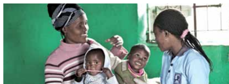
Läs mer om julkampanjen och Svenska kyrkans internationella arbete på www.svenskakyrkan.se/julkampanjen .

Mentormammorna är vanliga erfarna mammor som rekryteras för att i sina hemtrakter söka upp andra mammor som är i behov av stöd i att skapa sig ett tryggare liv.