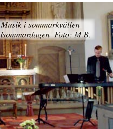
Musik i sommarkvällen sommardagen