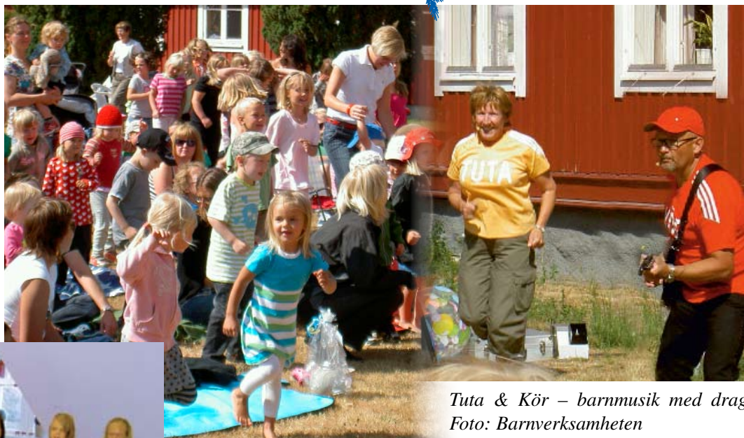
Tuta & Kör – barnmusik med drag