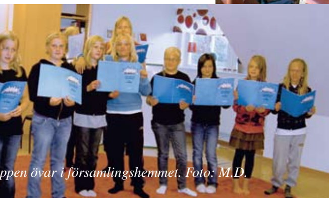
öppen övar i församlingshemmet.