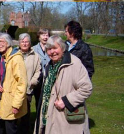
tfärd till Trolle Ljungby