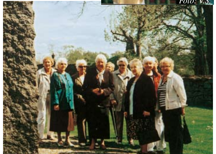
Lutherhjälpsgruppens utfärd till Jämshög, vid minnesstenen till hembygdens söner.