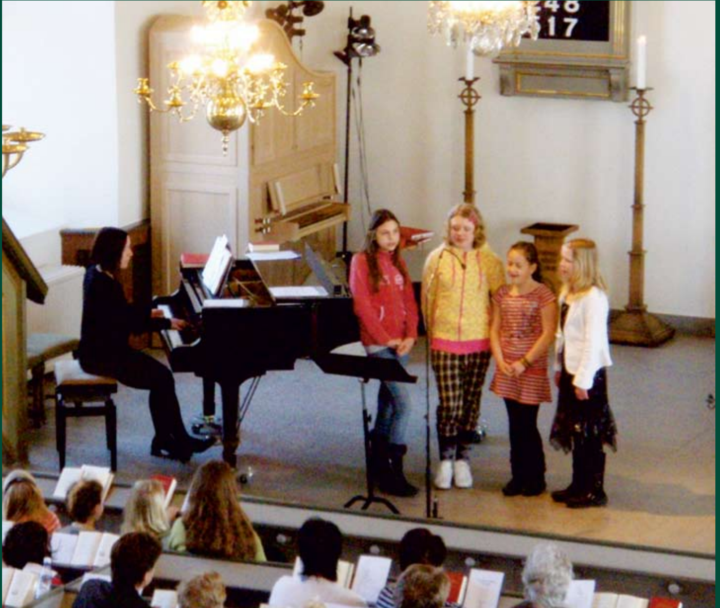
Barnkörens framträdande vid gudstjänsten den 13 april.