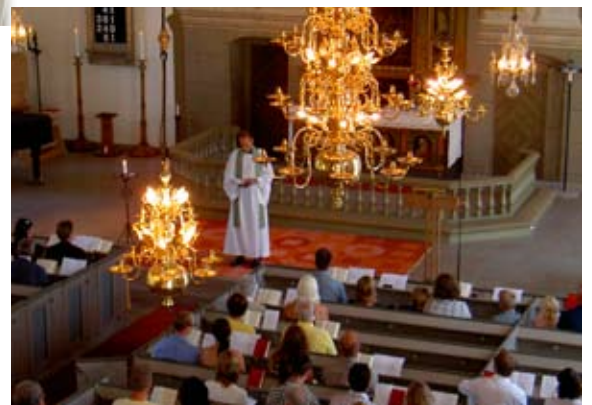
Gudstjänst den 27 juli