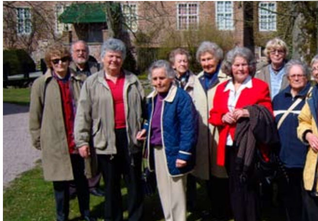
Lekmannakåren och Kyrkliga Arbetskretsen på u