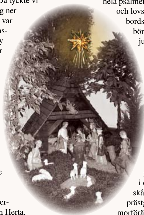
Foto: ”Mjällby kyrka vintern 2006”, M.B., ”Julkrubban år 2004”, M.B. Foto på syskonen Adrian ur ”Lunds stifts julbok 1965”