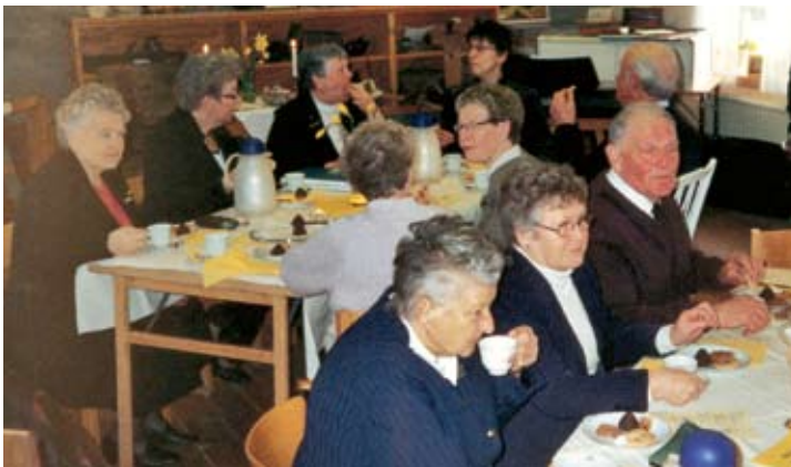
Påskgudstjänst i Hörviks museum annandag påsk, den 24 mars.