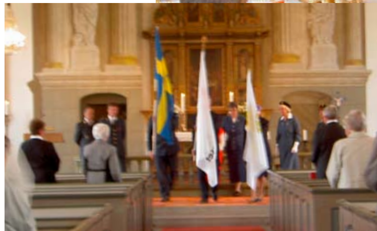
Kristi Himmelfärdsdag