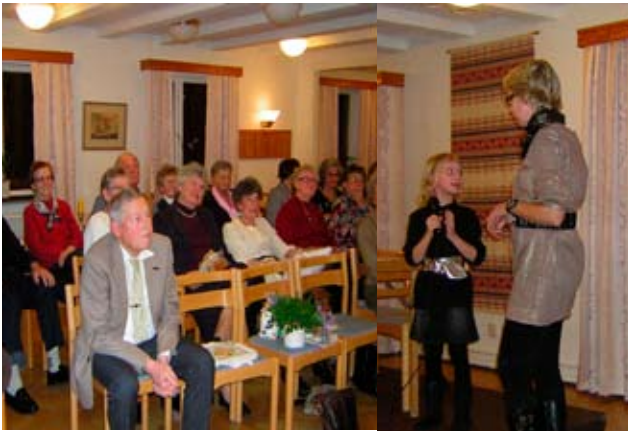
Kyrkliga Arbetskretsens vårförsäljning.

Utdelning av hedersgåvor till församlingens förtroendevalda vid kyrksöndag för förtroendevalda den 18 maj.