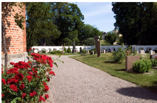
Kyrkogården med den omgärdande muren. I bakgrunden skymtar Tyresö slott.

Bogårdsmuren är uppförd i tegel och vittrappad med överkragat, putsat takparti, täckt med enkupigt tegel. På västra delen av sydsidan finns ringar för fastbindning av hästar. I murens insida finns 58 stickbågiga nischer. De sexton nischerna på sydsidan har inmurade röda sandstensplattor med inristadegårdsnamn. Bogården har två ingångar, en i söder och en i väster. Från den södra leder en allé upp till slottet. Porten flankeras av kvadratiska hörnstolpar med rester av en infälld sandstensportal. På grindstolparna sitter Oxenstiernas och de la Gardies vapensköldar. I båda ingångarna sitter svarta smidesgrindar.