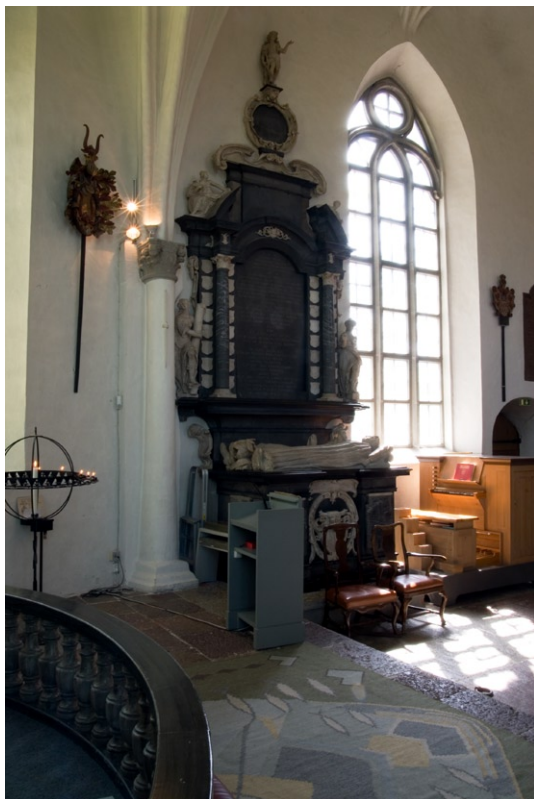
Det Oxenstiernska gravmonumentet i marmor.