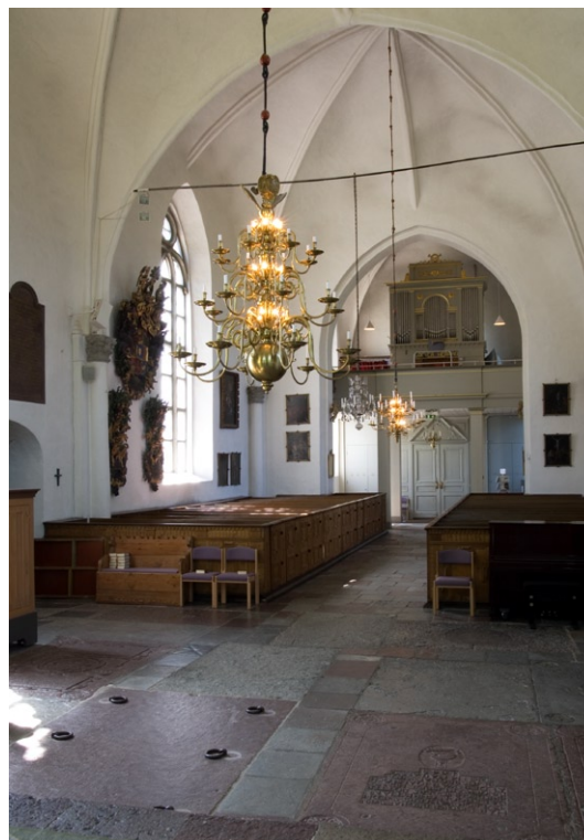
Kyrkorummet från öster.

I väst tillfogades kyrkorummet ett vindfång 1905. Det har vitmålade träfyllningar nedtill och småspröjsat glas upptill, för närvarande försatta med garderober. Dörren i vindfånget till kyrkorummet utgörs av en trefyllnings pardörr