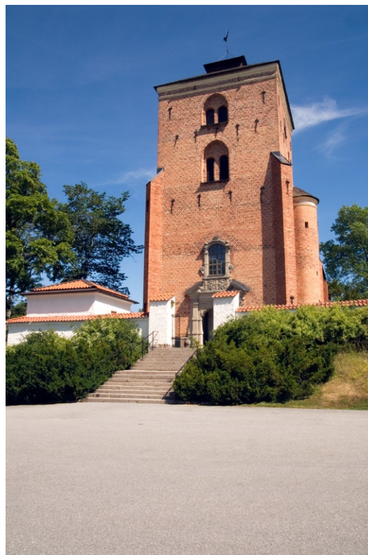
Kyrkobyggnaden från väster.

Tyresö kyrka är en salkyrka , bestående av västtorn och ett långhus som saknar gräns mot det tresidiga kor et. Västtornet är något smalare än kyrkan i övrigt. På sydsidan, i vinkeln mellan torn och långhus finns ett litet runt trapptorn med trappa till läktare och vind.