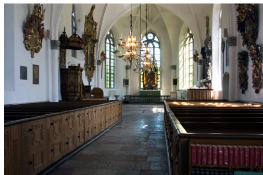
Kyrkorummet från väster.

Kyrkans slutna bänkinredning med profilerade listverk och stiliserad bladdekor i nedsänkt relief är tillverkad av Mäster Melcherdt vid kyr-