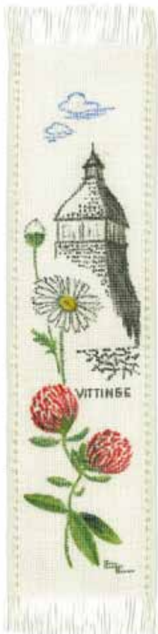
Ill. systrarna Edholm