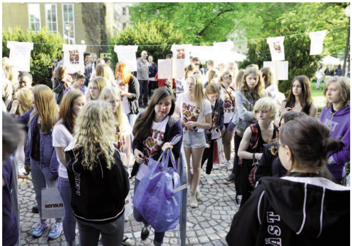
Konfafesten "Inte som du tror" den 25 maj i år – snart startar höstens grupper.