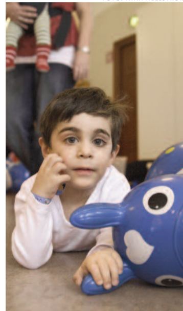
Svenska kyrkan i Örebro har en omfattande barnverksamhet.