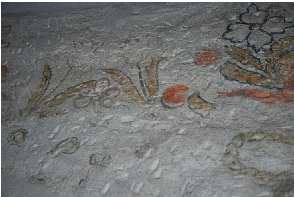
Spår av olika kalkhammare, från överputsning och framtagning.