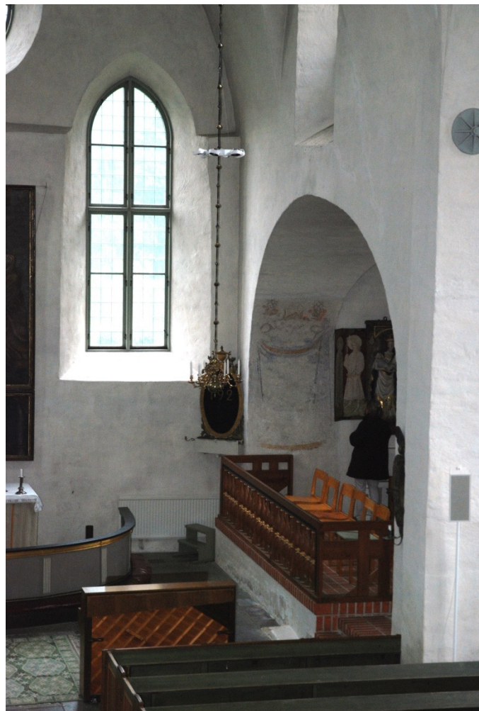
Skällviks kyrka, vy mot sydöst från västläktaren

Målningen är svårdaterad. Det ser närmast ut som ett målat epitafium, och skulle därmed kunna vara tillkommet i samband med en gravsättning i kyrkan, och har således troligen inte något direkt samband med ombyggnaden 1590-93.