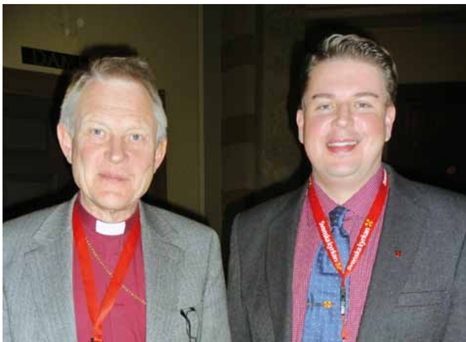
Ärkebiskop Anders Wejryd och artikelförfattaren i samband med Kyrkomötet i Uppsala, hösten 2010.

År 2006 tillträdde Anders Wejryd som ärkebiskop för Svenska kyrkan. Detta gjorde han efter vårt första ärkebiskopsval, som inte regeringen varit inblandad i sedan Gustaf Wasas tid. Svenska kyrkan är Sveriges största organisation samt världens största lutherska kyrka med ca sju miljoner medlemmar.