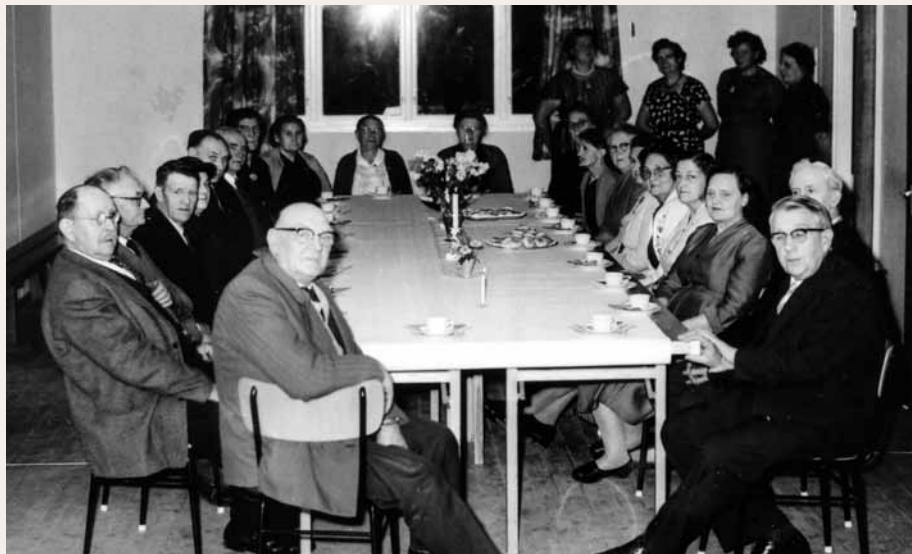
Nybildad pensionärsförening i Mjällby.