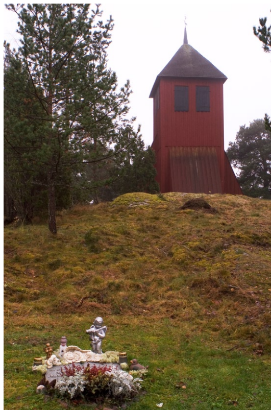
Klockstapeln vid Össeby-Garns kyrka.

Klockstapeln står på en kal berghäll öster om