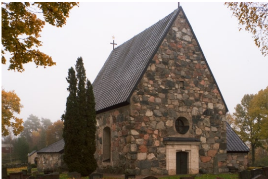
Exteriör från väster.

Kyrkan har två ingångar, en genom vapenhuset och en i västgaveln. Ingången till vapenhuset har en stickbågig öppning med flersprångig slamrad tegelomfattning. Dörren av tjocka ekplankor är försedd med senmedeltida järnbeslag. Ingången genom västgaveln togs upp vid 1800-talets mitt. 1926 vidgades ingången och försågs med en putsad omfattning av tegel med kvadrerade pilastrar och kopparklädda dörrar 1926 efter ritningar av arkitekten Knut Nordensköld.