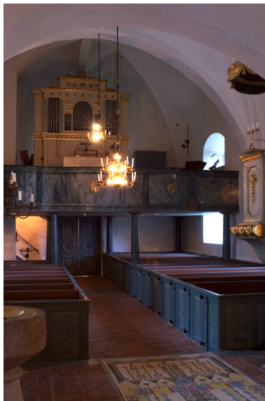
Kyrkorummet åt väster.

Det medeltida kyrkorummet bevarar mycket av sin 1700-talsinredning. Den grönmarmorade predikstolen med förgyllda ornament är ett verk av en mästare Anders Ruback i Stockholm och uppställdes i kyrkan 1782. Från samma tid är en nummertavla i snidat trä. Bänkin-