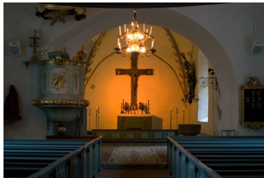
Kyrkorummet åt öster.

redningen är insatt vid en restaurering 1926 och är utförd med samma färg och form som 1782-års bänkar. Läktaren uppfördes ursprung-