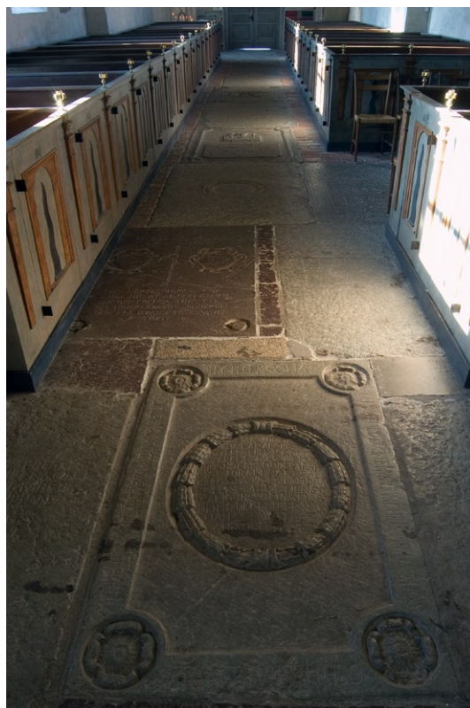
Gravhällar i Lovö kyrkas mittgång.

made väggar och innertak. Ursprungligen täcktes koret av ett valv, men det ersattes av ett plant innertak 1713. Långhuset täcks av ett gipsat trätunnvalv, tillkommet under renoveringen vid 1600-talets slut, i anslutning till att gravkoret uppfördes. Då vitlimmades även kyrkorummet. I samband med 1930-talets renovering, blottades dock resterna av kyrkans äldre kalkmålningar, tillkomna under olika tidsepoker. Från medeltiden härrör de fem röda invigningskorsen i kyrkans västra del. Dessutom finns två solformade invigningskors, som troligen härstammar från 1400-talet och i så fall tillkom i samband med valvslagningen. De medeltida nischerna på södra långsidan är dekorerade med