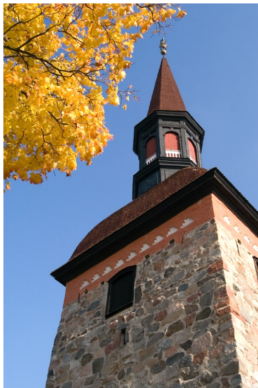
Det medeltida tornet med tornspiran från 1700-talet.

I samband med renoveringen 1935 togs kyrkans medeltida, och tidigare igensatta fönsteröppningar åter fram varför de yngre respektive äldre fönstren nu är lämnade sida vid sida på långhusets fasader. De medeltida fönsteröppningarna syns längst åt väster. Bredvid det södra medeltida fönstret syns dessutom spår av en igenlagd fönsteröppning från 1200-talet.