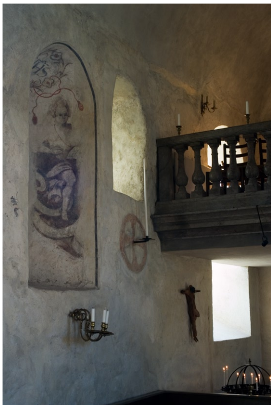
Södra väggens rundbågenisch med kalkmålning av Johan Sylvius.

spår av en öppning i murverket. Möjligtvis fanns här en liten sångläktare, en så kallad gapskulle, under medeltiden. Till läktaren kom man sannolikt via sakristievinden .