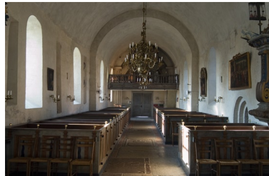
Interiör mot väster.

Interiört kan kyrkans olika utbyggnadsetapper avläsas tydligt, inte minst tack vare långhus -väggarnas bevarade avsatser. Innan gravkoret uppfördes under 1600-talet fanns kyrkans kor i nuvarande långhusets östra del. Ännu vittnar bjälkhålen i långhusets väggar efter triumfkrucifixets trabes , om den medeltida kyrkans utformning med dess gräns mellan kor och långhus . På norra långhusväggen finns dessutom