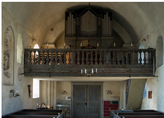
Interiör mot väster med läktare och orgel.

Sakristian uppfördes i samband med att kyrkan förlängdes åt öster. Golvet är belagt med tegel och innertaket är täckt av plana bräder, insatta 1884 då de ersatte ett äldre valv. Den ursprungliga ingången mot kyrkan är rundbågig. Under 1800-talet var denna ingång igensatt och ersatt av en förbindelsegång av korsvirke öster om sakristian som ledde till en numera igenmurad öppning i korets norra vägg. Förbindelsegången revs i samband med reoveringen 1935 varpå den ursprungliga dörren åter togs upp. Vid samma reovering ändrades sakristians nordöstra fönster, ursprungligen upptaget under 1800-talet, till en väggnisch. Det sydöstra fönstret har förstorats sekundärt.