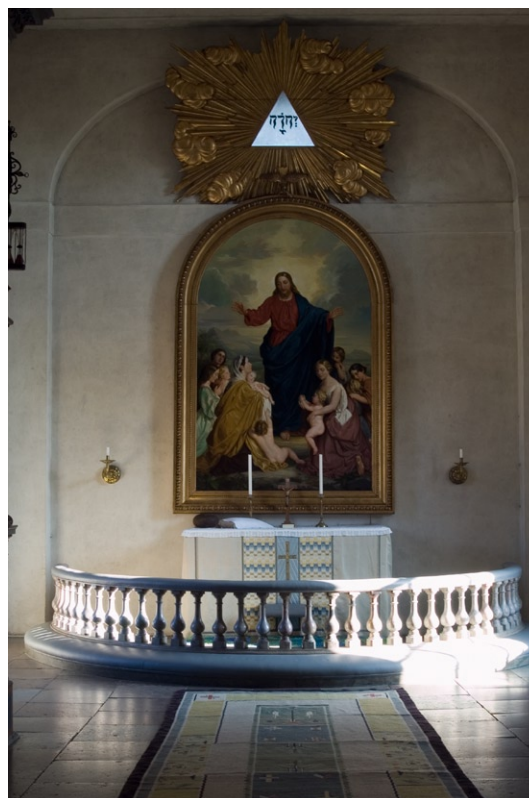
Lovö kyrkas altare med altartavla från 1860-talet, målad av Carl Plagemann.

Burchardt Prechts verkstad. Den är en gåva från drottning Ulrika Eleonora d y och består av korg med trappa som bl a dekoreras av voluter och fält med akantusornament . Predikstolen är försedd med ett ljudtak, även det rikt dekorerat. Timglaset skänktes till kyrkan 1717. Då predikstolen flyttades mot öster under 1760-talet gjordes vissa kompletteringar i korgens nedre del. Altaret murades i samband med renoveringen 1935. Altartavlan med motivet "Kristus välsignar barnen" utfördes 1866 och är signerad av Carl Plagemann (1805–1868). Altarringen av svarvade balusterdockor kom till två år tidigare. Ovan altartavlan deko-