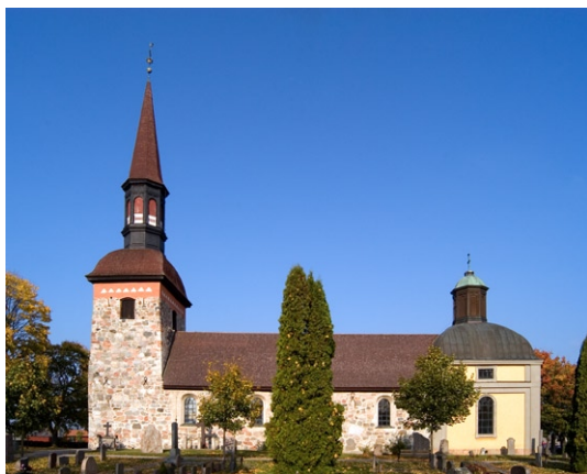
Exteriör från söder.

nuvarande tornavslutningen uppfördes 1727–28, på bekostnad av drottning Ulrika Eleonora d y och sockenbornas bidrag. Taktäckningen är utformad som en barocksvängd huv, klädd med spån och krönt av en åttkantig lanternin med spira. Även långhusets och sakristians sadeltak är täckta av spån. Takkonstruktionen över långhuset stammar från 1600- och 1700-talen, men kompletterades under renoveringen 1935.