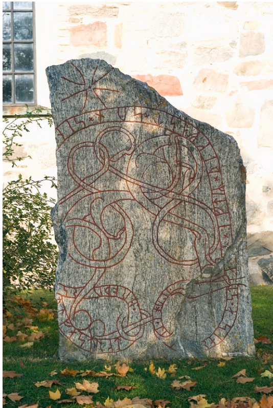
Runsten utanför Lovö kyrka med inskriptionen: "Illuge lät resa stenen efter Tingfast, sin son --- fast efter sin broder.

Monumentet är utformat med en cirkelformad sockel i sten kring en gräsbevuxen kulle. På denna står en obelisk av slipad kolgårdsmarmor, krönt av en förgylld stjärna. På kyrkogården finns ett flertal runstenar uppställda. Dessa flyt-