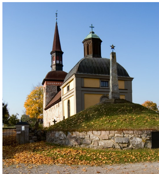
Kyrkan med släkten von der Lindes gravkor från 1670-tal ritat av Nicodemus Tessin d ä samt gravmonument över skalden Olof von Dalin och matematikern Samuel Klingenskierna ritat av Jean Eric Rehn.

Kyrkogårdens ursprungliga och äldre del ligger söder om kyrkan. Under 1840-talet och 1917 utvidgades kyrkogården norrut. Kyrkan och kyrkogården inramas av en bogårdsmur , uppförd under olika perioder och kring kyrkogården växer en välbevarad trädkrans. 1835–37 genomfördes trädplanteringar på den gamla kyrkogården och cirka tretton år senare på kyrkogårdens yngre del. Flera av de bevarade lönnarna härstammar säkerligen från dessa planteringar. Gamla kyrkogården har två entréer, en mot öster och en i väster, båda flankerade av vitrappade grindstolpar försedda med enkla järngrindar. Kyrkogården domineras av de stående gravstenarna, några försedda med stenram eller smidesräcke, men här finns även några gravvårdar av gjutjärn.