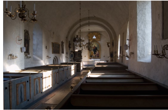
Lovö kyrka mot koret i öster.

tvärribba, vilket tyder på att det funnits ett hål som förbindelseled mellan bottenvåningen och tornets övre våningar. I tornrummet står kyrkans medeltida dopfont samt en gravhäll av sandsten. Hällen härrör från omkring 1060 och är sannolikt huggen i Sigtuna.