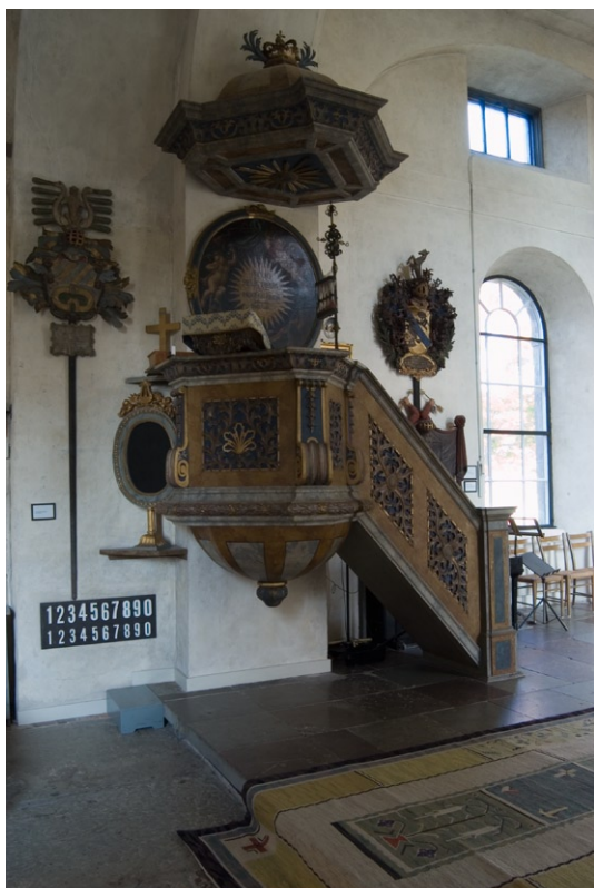
Predikstolen i Lovö kyrka.

Av kyrkans inredning märks främst predikstolen, uppförd 1718 och troligen tillverkad i