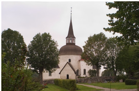
Exteriör från söder.

Klockstapelns står på en kulle sydväst om kyrkan. Den uppfördes 1724–28 och hade då