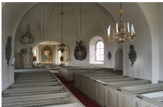
Interiör mot öster och rundkyrkans stjärnvalv.