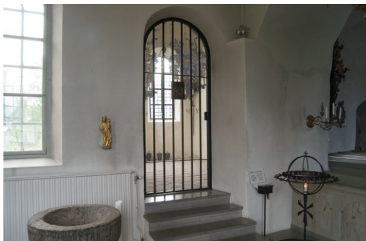
Interiör mot gravkoret i söder.

I samband med 1960-talets renovering tillkom det nuvarande altarbordet med en skiva av en gravhäll från 1600-talet. Altarringen tillverkades under 1730-talet, men ändrades och utvidgades under 1860-talet. Idag finns en glasmålning på altaret, föreställande Kristus på korset. Målningen, som skänktes till kyrkan 1905 omges av ett äldre ramverk som härrör från 1719.