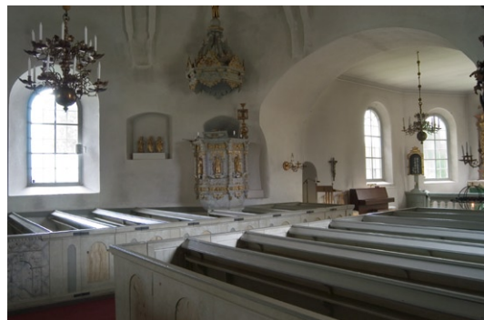
Interiör mot predikstolen i norr.