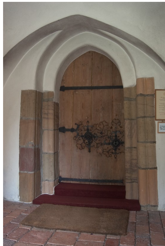
Den ursprungliga sydportalen.

Portalen mellan vapenhuset och rundhuset är kyrkans ursprungliga entré. Endast den nedre delen har dock kvar den ursprungliga omfatt-