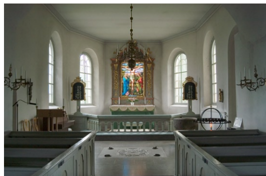
Interiör mot koret i öster.

ningen av profilerad, grå sandsten som framträder i murens ytterliv. Uppåt avslutas portalen av en spetsig båge, troligen tillkommen under 1300-talet. Den sekundära bågen är utförd i tegel. Portalens innerdörr bevarar medeltida järnbeslag.