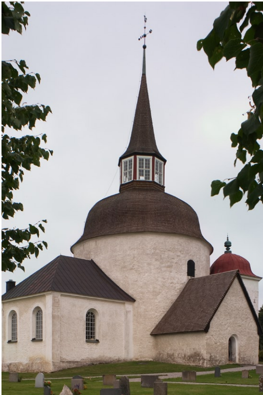
Exteriör från sydväst.

korets och västra tillbyggnadens rundbågiga fönsteröppningar. Gravkoret i söder har äldre glas i blyspröjsar, som är fästade i rödmålad järnplåt. Innan sakristian uppfördes i nordost fanns ett fönster mot samma riktning. Det är numera igensatt, men syns interiört i form av en nisch.