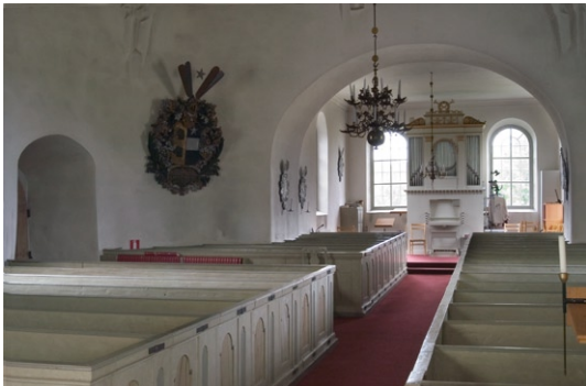
Interiör mot orgeln i väster.

Kyrkorummet fylls av bänkkvarter på vardera sidan om en mittgång. De slutna bänkarna tillkom under 1770-talet men blev ombyggda 1838 och 1856. Senast byggdes bänkarna om i samband med renoveringen under 1960-talet. Då sattes även en äldre bänkdörr in, antagligen från den bänkinredning som fanns i kyrkan under 1650-talet.