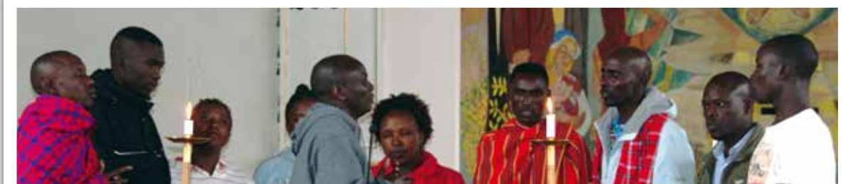
Finken Educational Centre från Kenya på besök.