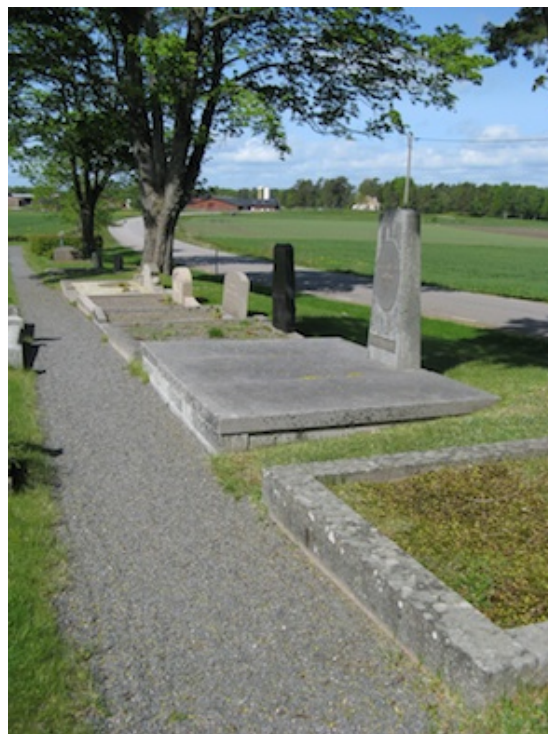
Rad med grusgravar i kvarter 1.

Utanför kyrkogårdsmuren i sydost ligger en personalbyggnad från tidigt 1900-tal med faluröd träpanel.