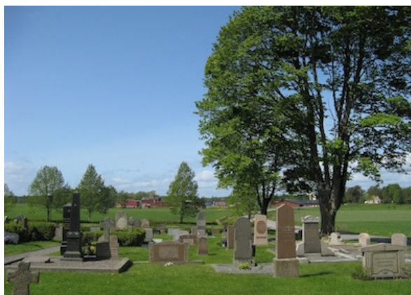
Vy över kyrkogården åt väster.

Parkbänkar finns i tre olika modeller, i gjutjärn och trä. I nordväst finns en grönmålad vattenpump av äldre modell. Servicestationerna är enkelt utformade med vattenpost och verktyg stående på marken intill. Det finns ingen konstnärlig utsmyckning på kyrkogården.