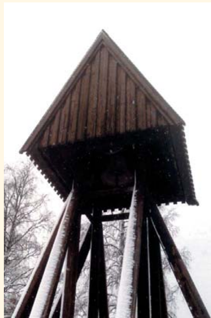
Krokoms klocka och klockstapel med tolv pelare. Symbol för kyrkans tolv apostlar och de tolv stammarna i Israel.