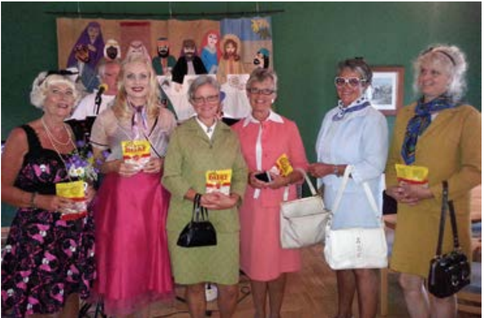
Priset för bästa outfit på 50-talskvällen var en påse Ahlgrens bilar, vilka började tillverkas 1953.

Har du idéer eller önskemål på evenemang till nästa års festvecka? Vill du vara med och hjälpa till under våra evenemang? Hör av dig till kansliet!