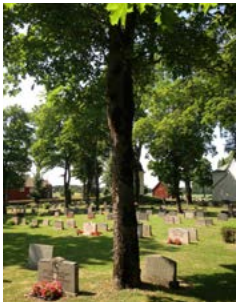
Det finns många vackra träd på kyrkogården. Tyvärr måste flera av dem fällas, då de innebär en olycksrisk.

framöver är kyrkovalet. Det är viktigt att du kommer och lägger din röst i de tre valen. Du väljer ledamöter till Kyrkomöter, Stiftsfullmäktige i Uppsala stift och till Kyrkofullmäktige i Vittinge församling.