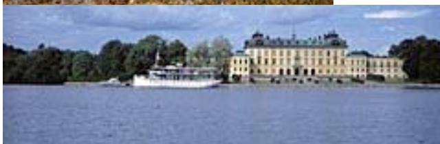
Två bilder av de svenska världsarven Laponia (överst) och Drottningholms slott (nederst) som representerar helt olika kulturmiljöer med globalt värde.