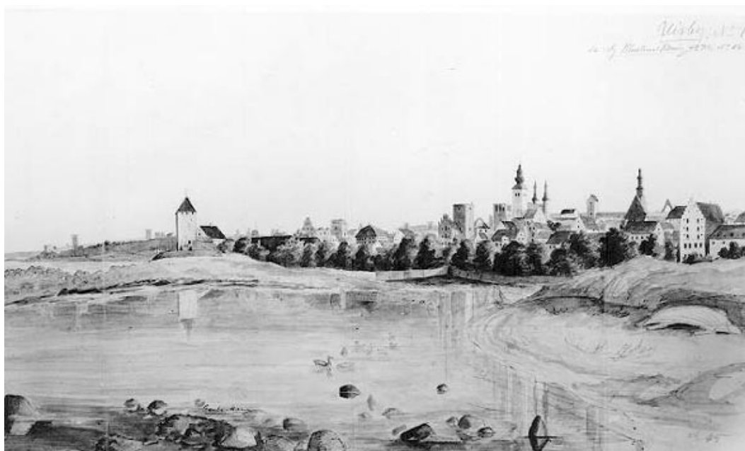
Tecknad bild av P A Säve över "Gamle hamn" i världsarvsstaden Visby från 1840-talet.

Forskningen på Högskolan på Gotland skulle påverkas positivt av en nominering. Den skulle till en början troligen först och främst uppmärksamma det utökade världsarvet, men också se helheten, dvs. att det är ett gotländskt världsarv och inte bara Visbys. De gotländska kyrkorna, deras arkitektur, inventarier och konst är redan föremål för forskning men borde kunna utvecklas ytterligare. På Högskolan har det diskuterats ett utbildningsprogram med medeltiden som tema och i en sådan utbildning har kyrkorna och deras konstskatter en given plats. Möjligheter för att få till stånd ett centrum för medeltidsstudier borde kunna bli aktuell och då knytas till Gotland med hjälp av den ökade status som en världsarvsnominering av kyrkorna kunde ge.