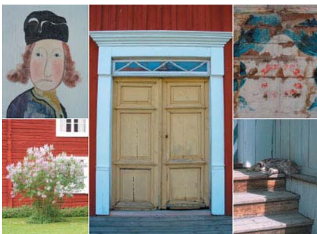
Världsarvet gruvstaden Røros med omnejd