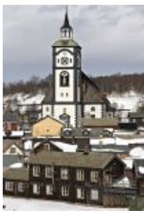
Vy över världsarvet gruvstaden Røros i Norge med kyrkan i fonden.