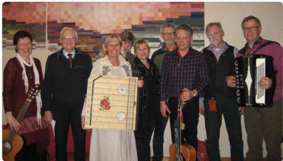
Afton med Skillingtryck i Ö. Kärrstorp den 6 februari