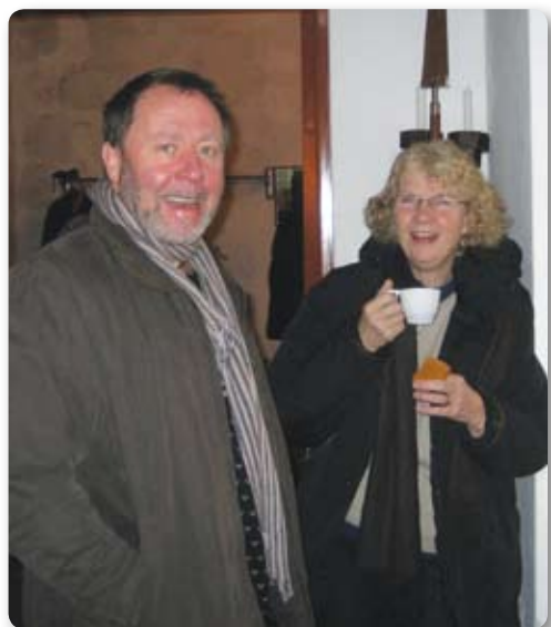
Kaffemingel efter gudstjänst i Fränninge kyrka