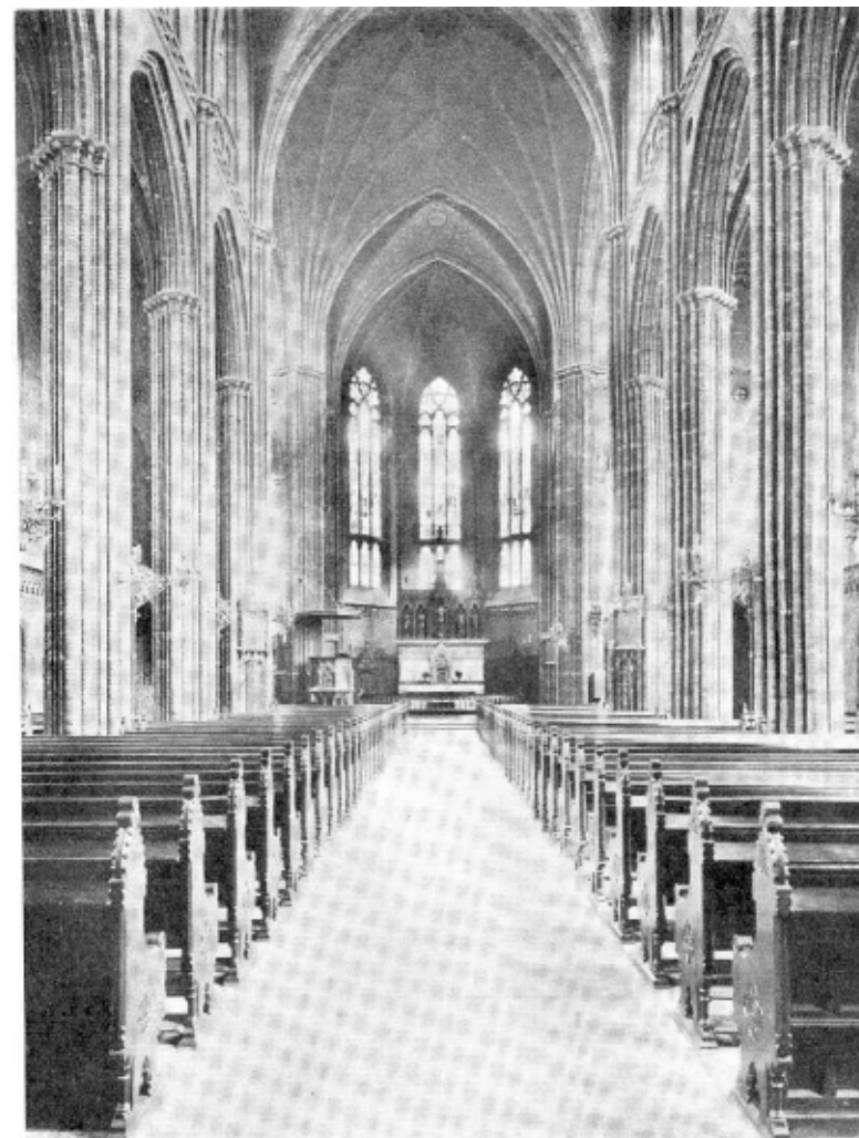
S:t Johannes kyrka, intreör.

Inviingshögtidligheten inleddes med psalmen 325, som sjöngs även blandad kör, ackompanjerad av orgeln, uti vilken dock blott halva antalet stämmor hunnit bliva färdiga.