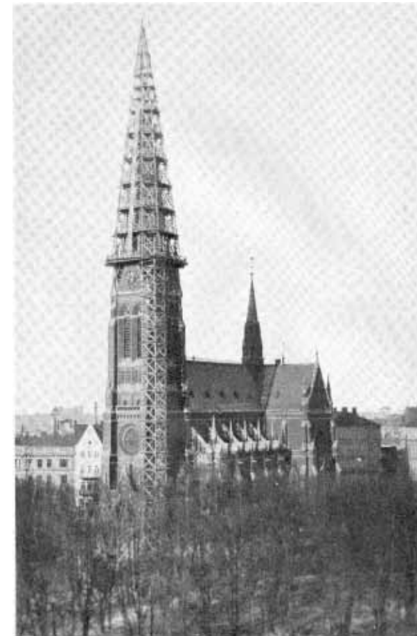
Kyrkan under reparationen 1929 – 1930.

stora portalen uppställda bilderna, föreställande apostlarna Petrus och Paulus.