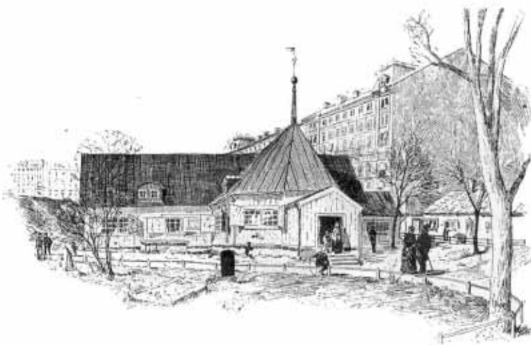
Bild av den gamla kyrkan.

Med anledning härav framlades på kyrkostämman den 14 december 1880 frågan om byggande av en ny S:t Johannes kyrka. Kyrkorådets begäran bifölls. Genom votering beslöts med 242 röster mot 85, vilka avgåvos för återförvisning och vidare utredning, att den nya kyrkobyggnaden skulle komma till utförande.