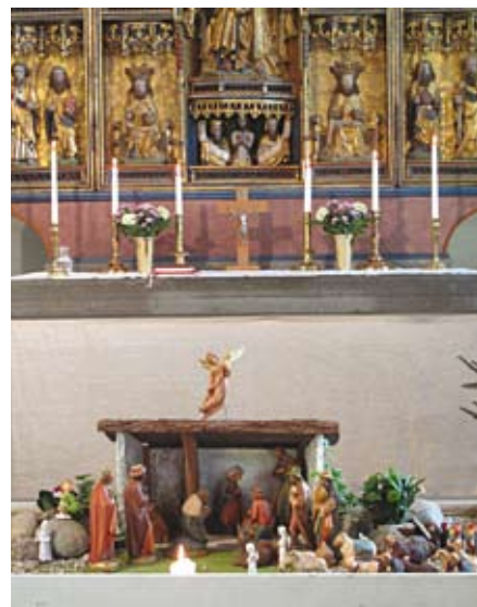
Julkрубban i Lena kyrka

Missa inte utställningen om vänförsamlingsarbetet och Highfields församling i Harare. Finns att se i kyrkan hela hösten!