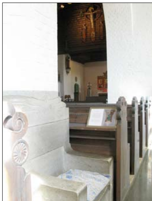
Fyra viloplatser (5.2)