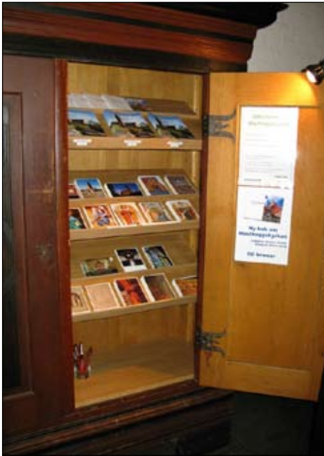
Skåp i vapenhuset (2.6.2)