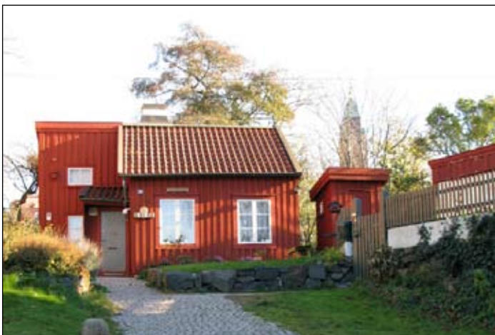
Goda grannar (3.1.1)