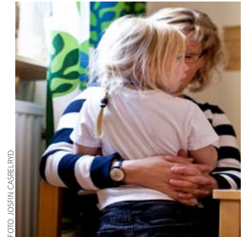
Familjen kan behöva stöd för att prata med barnen om en förälders sjukdom.

När mamma eller pappa insjuknar bemöts barnen oftast med tystnad både inom sjukvården och i hemmet. Det visar en studie som gjorts av Neurologiska kliniken på Karolinska universitetssjukhuset i samverkan med Neurologiskt Handikappades Riksförbund.