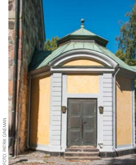
Poluska gravkoret är idag väntrum.