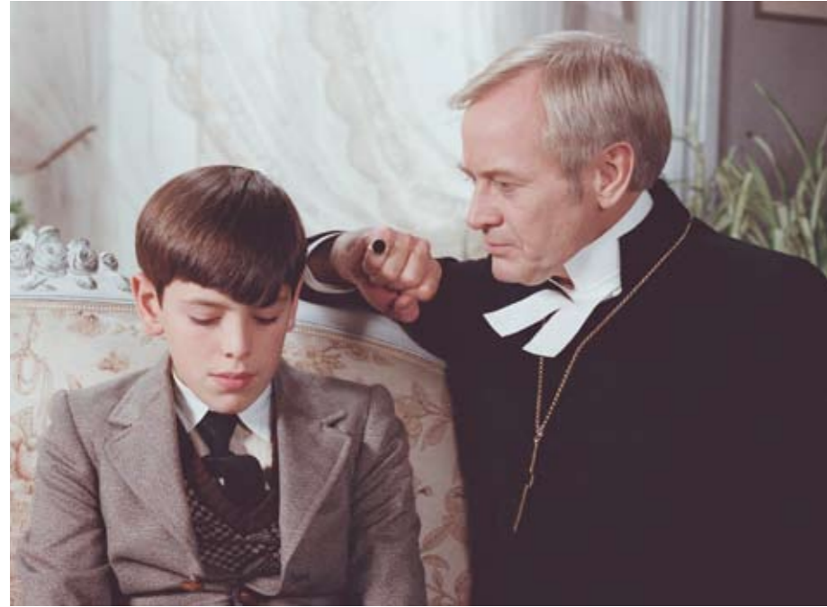
Mest ihågkommen som Bergmansk fadersfigur är Jan Malmström som den ondskefullt brutale biskop Vergerus i Fanny och Alexander .

och med kännas som att prästemat i populärkulturen har blivit ett accepterat sätt att prata om män med kontrollbehov. Därigenom är den misslyckade eller missanpassade prästen i dagens filmer mer besläktad med berättelser om psykologer som behöver hjälp av sina patienter och vetenskapsmän som förlorar kontrollen över sina experiment, än med till exempel prästen i Nattvardsgästerna .