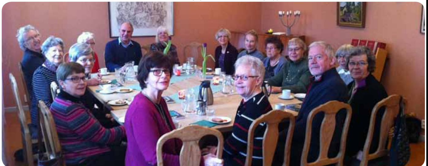
Studiecirkeln Inför Söndagen