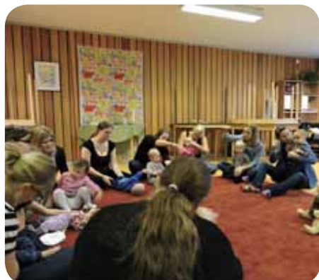
Bilder från barnverksamheten: