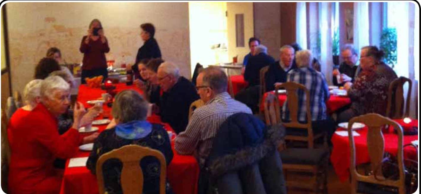
Julfest i församlingshemmet