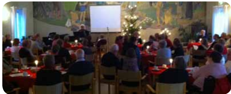
Luciafest i församlingshemmet