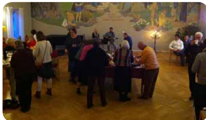
Internationell fest i församlingshemmet