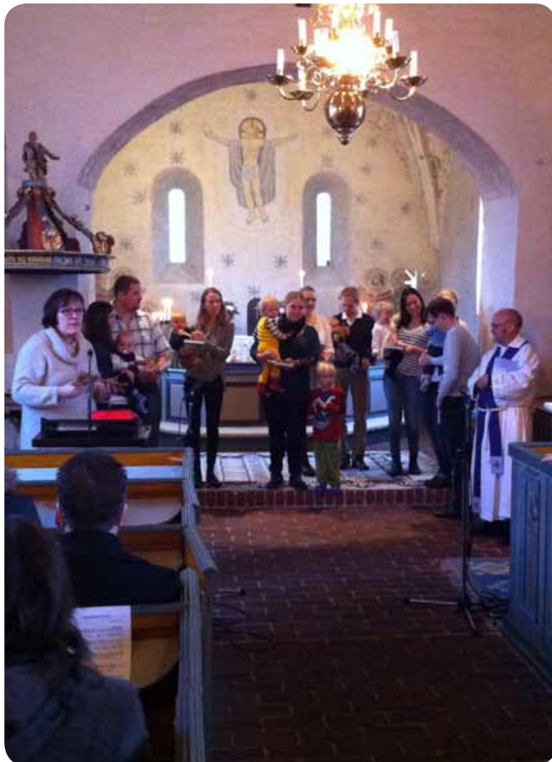
Årets dopfest i Emmislöv