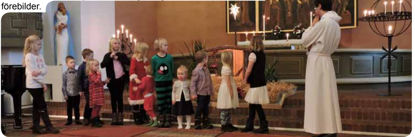
Barn och ungdomar är framtidens församling redan nu!