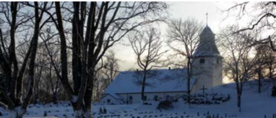
Stora Mellby Kyrka