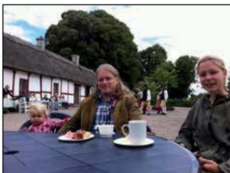
Kulturdagen i Brandstad