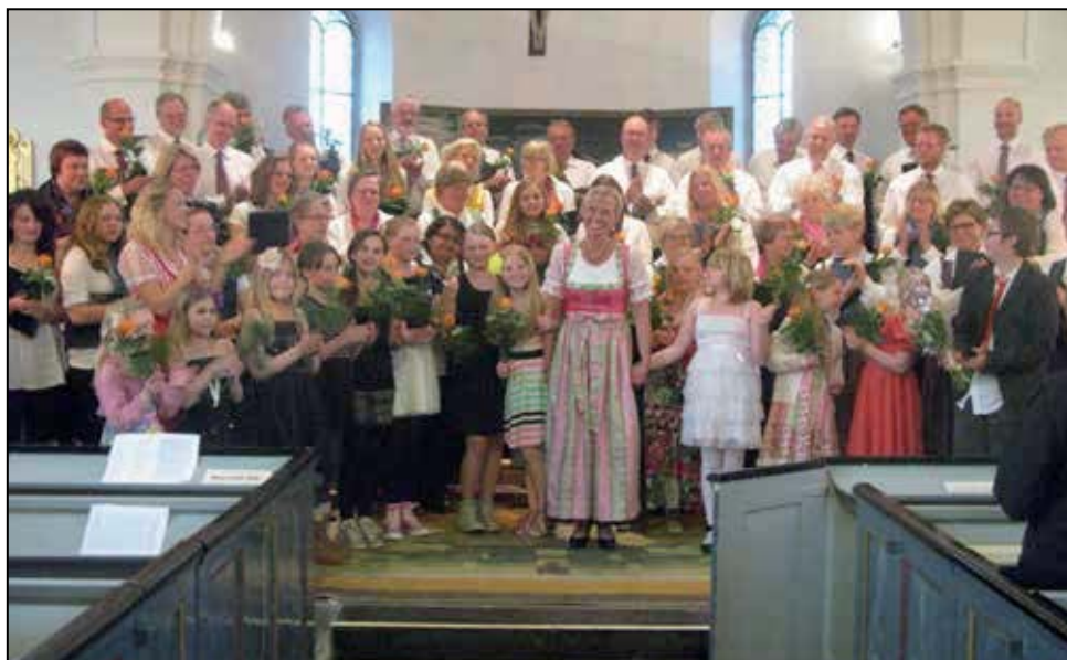
Sound of Music i Fränninge