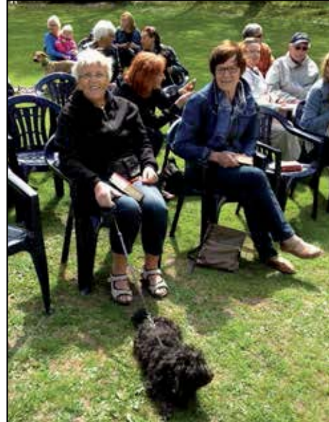
Djurgudstjänst i Fränninge