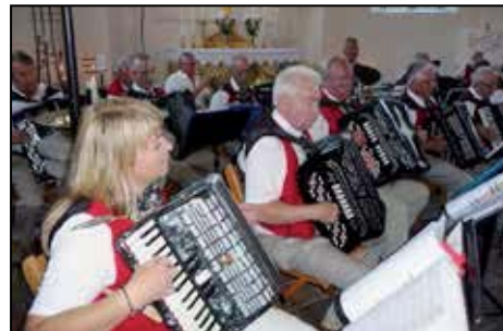
Musik i sommarkväll i Öved