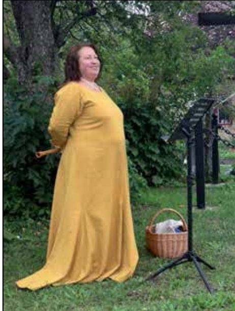
Gudstjänst på Skartofta Ödekyrkogård