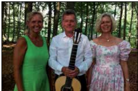
Vandringsgudstjänst i Hårderupshult