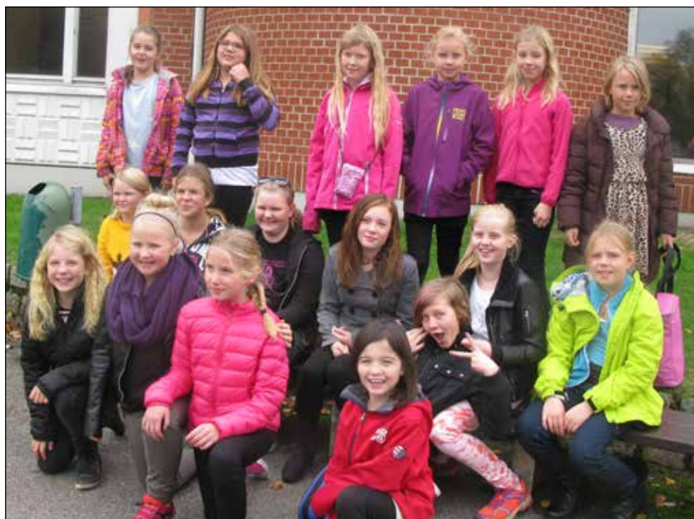
Körbarnen på Sjung Gung i Lund