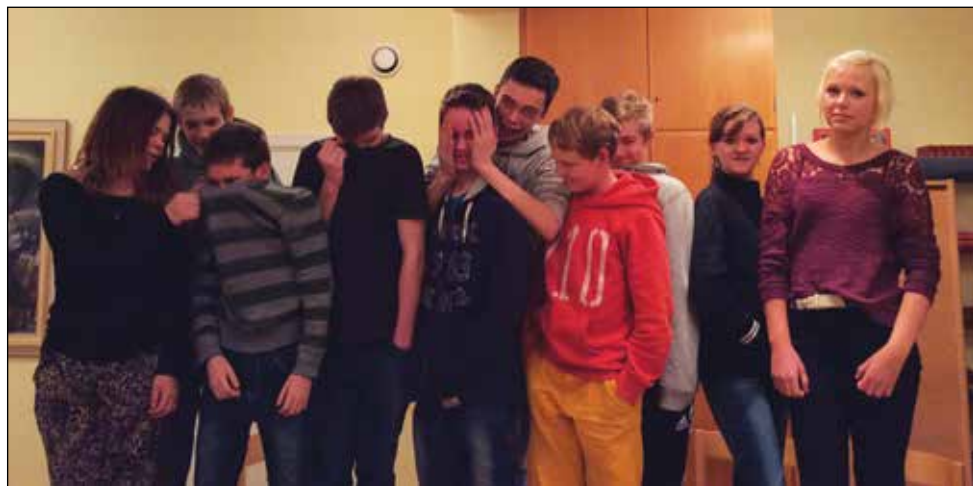
Höstens härliga konfirmandgång