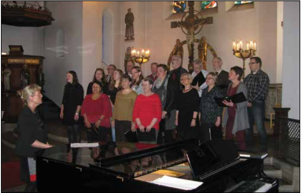
Himlarösters utflykt till Gustafskyrkan i Köpenhamn den 8 februari