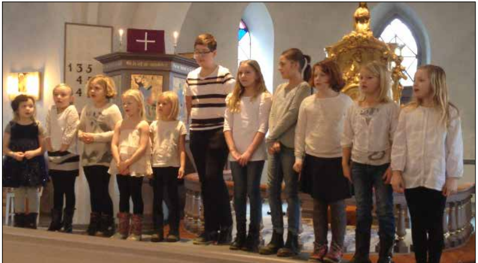
Barnkörerna sjunger på Änglagudstjänsten i Vollsjö kyrka den 15 februari