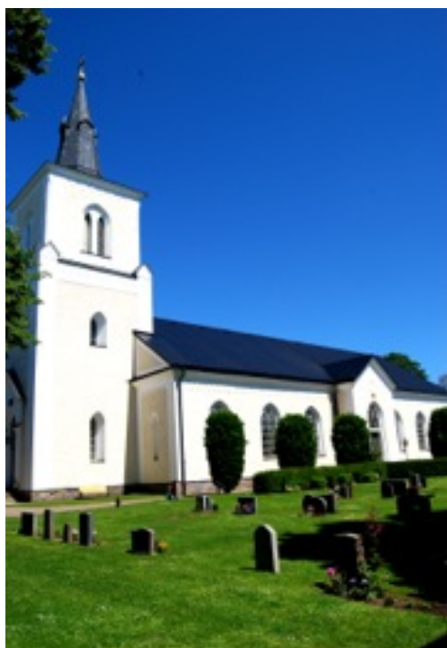
Förlösa kyrkogård, gamla delen