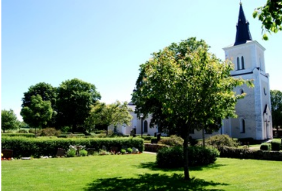
Förlösa kyrkogård, nya delen

Gravplats för en eller två kistor. Platsen har en gravrätt, man kan ha en gravanordning och plantering. Gravrättsinnehavare ansvarar för gravens skötsel.