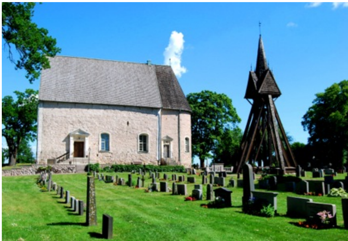
Kläckeberga kyrkogård, gamla delen