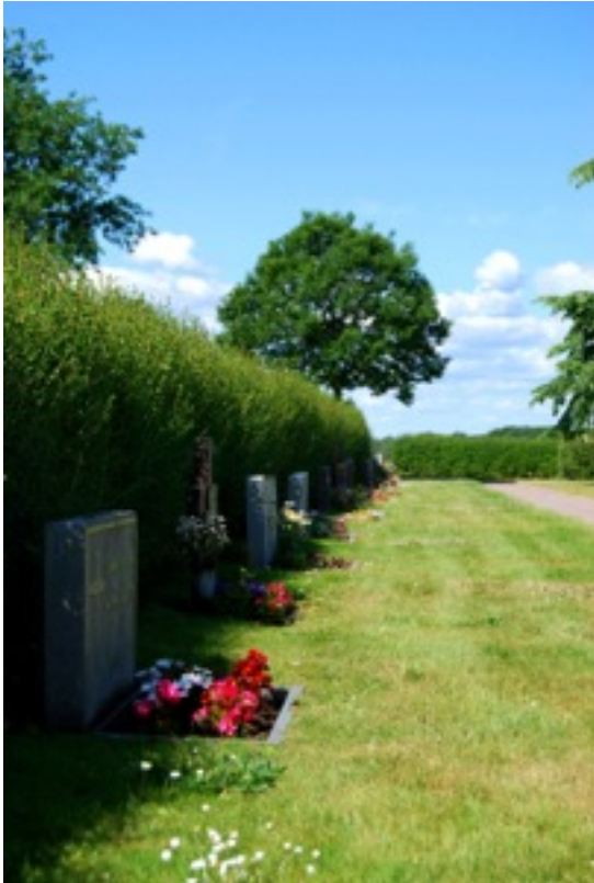
Kläckeberga kyrkogård, nya delen