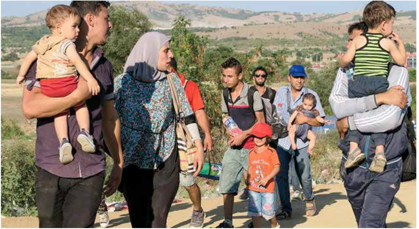
Krig, oroligheter, fattigdom och klimatförändringar driver miljontals människor på flykt!