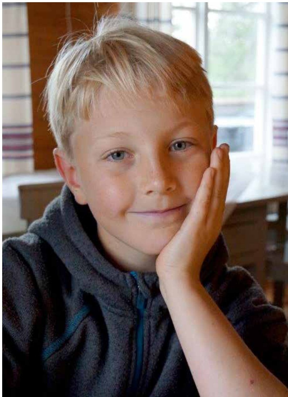
– Vi pratar rätt mycket hemma om att hjälpa människor som har det svårt och på vilket sätt det kan se ut.

– Man fick gå in i ett uppbyggt rum och sen spelades det film på alla väg-garna, man fick se hur det såg ut där de åt sin mat, hur de sov och hur det såg ut där läkarna jobbade och barnen föddes. Det kändes som om man var i lägret. Då känns det viktigt att hjälpa till, säger Calle.