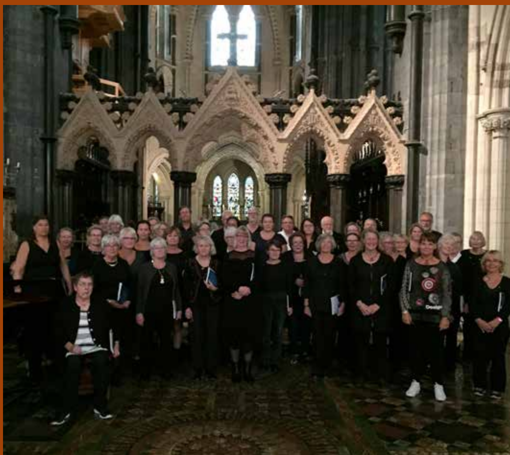
Kyrkokörerna från Djurö, Möja och Nämndö i Christ Church Cathedral, Dublin.

På söndagskvällen åt vi en gemensam middag i 'The Church', en kyrka som gjorts om till restaurang. Kvar finns en magnifik orgelfasad av en orgel som bland annat spelats på av Händel! Måndag blev vår resdag hemåt, vi flög till Arlanda via Köpenhamn.