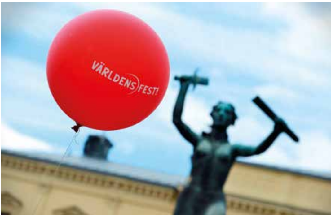
I år hölls Världens fest i Karlstad.