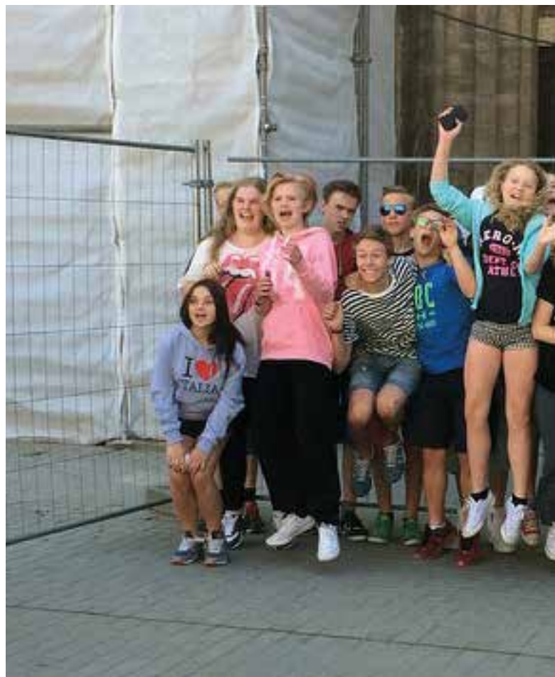
Hela gruppen framför kyrkan i Wittenberg där Martin Luther spikade upp sina 95 teser

Campingen är mycket trevlig. Det finns en pool som brukas flitigt i värmen. De obligatoriska badmössorna blir speciellt uppskattade. En del hyr cyklar och cyklar omkring på området. Det finns gott om gröna områden och god mat. På campingen har vi konfirmationsundervisning och ledarutbild-