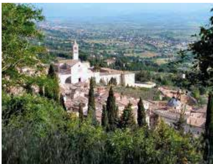
Assisi med den helige Franciskus basilika.