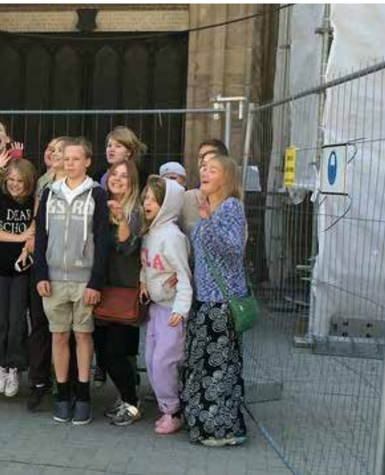
... som reformerade kyrkan och lade grunden för protestantismen.

taurering fram till jubileet 2017. Vi fick se dörren där Martin Luther spikade upp sina 95 teser som reformerade kyrkan och lade grunden för protestantismen.