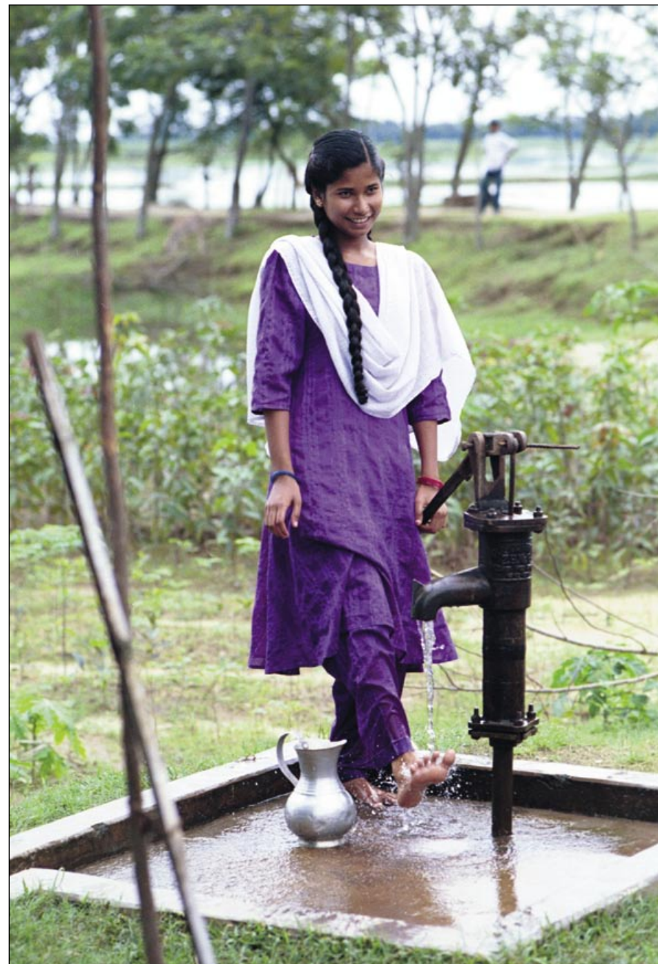
Rent vatten är en förutsättning för ett värdigt liv. Bilden är från Bangladesh.

www.svenskakyrkan.se/internationelltarbete