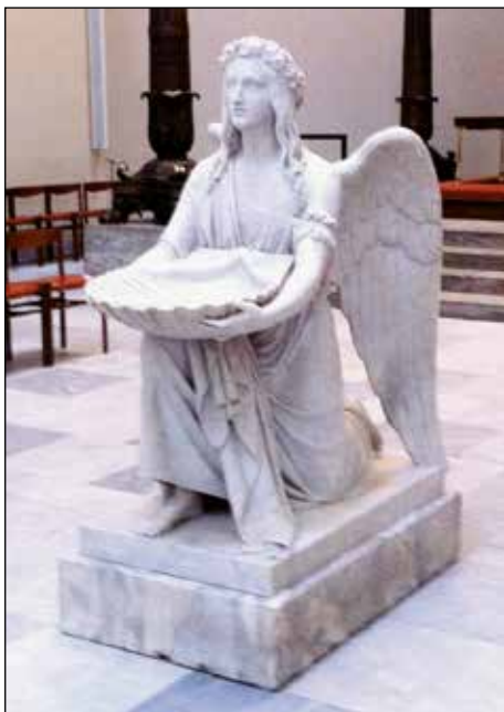
Thorvaldsens dopängel Vor Frue Kirke Köpenhamn.

Dopängeln i Lomma kyrka är av danskt ursprung och har sin alldeles egna berättelse. Originalen i gips förvaras på Ny Carlsbergs