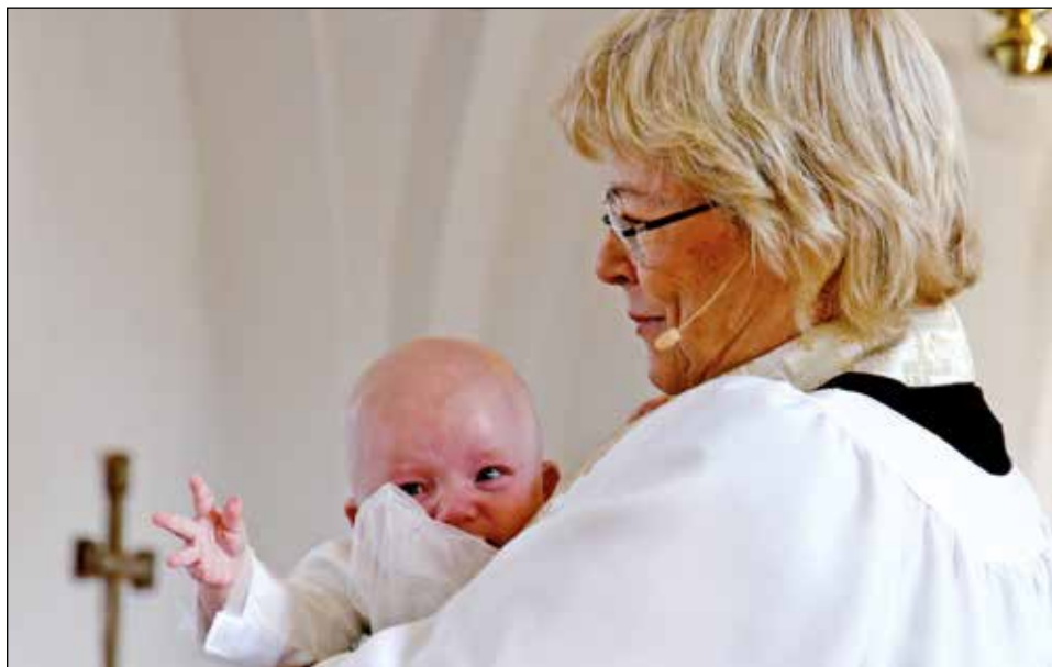
Den nydöptes små fingrar pekar på korset, på vilket världens Frälsare är fästad.