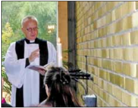
Kyrkoherden inviger ljusbäraren.

i livet. Några tänder ett ljus i samband med att man visar sin personliga respekt för den döde då de defilerar och stannar en stund vid kistan. Den första ljusbäraren i modern tid i Sverige införskaffades till Uppsala domkyrka i samband med Kyrkornas världsråds generalförsamling år 1968. Den har formen av ett träd och bär namnet "Folkförsoningens träd".