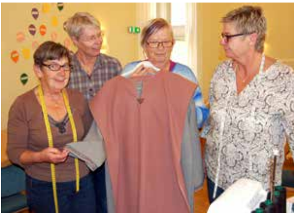
Den här dräkten kommer att bäras av någon av de medverkande vid "En natt i Betlehem".