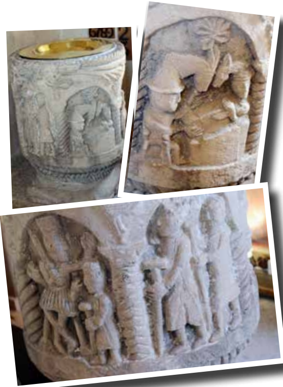
Dopfunten i Norra Lundby kyrka berättar om julens glada budskap! Överst till höger Jesu födelse och nedre bilden de tre vise männen hos Herodes.

DOPFUNTEN I NORRA LUNDBY är unik. Den berättar för oss om hur Gud blev människa i Jesus Kristus – julens glada budskap!