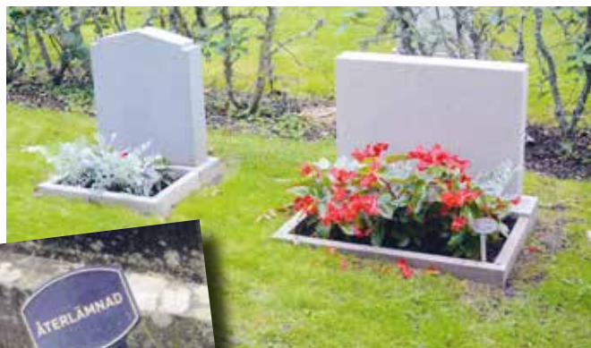
Återlämnade gravar märks med en liten skylt. Gravstenarna kan sedan återanvändas till nya gravar.

För kyrkan - och för många andra - är det viktigt att vårda kulturarvet. Många uppskattar den kulturhistoriska park som många kyrkogårdar utgör. Därför har alla kyrkogårdar med dess gravstenar inventerats och en bevarandeplan har tagits fram. Det är denna man utgår ifrån i arbetet. Gravstenarna har klassificerats utifrån siffrorna 1-3, där klass 1 bedöms ha mycket stort kulturhistoriskt värde. Det kan till exempel handla om en väldigt speciell sten, om själva gravvårdens utformning eller om att en historiskt intressant person har begravts där. Dessa "klass 1-gravar" bevaras genom den begravningsavgift som alla folkbokförda i