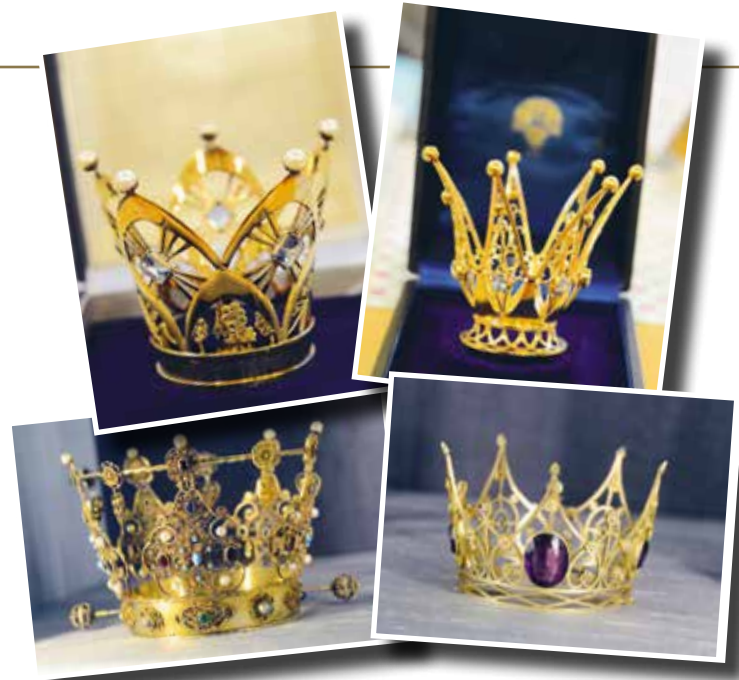
Överst till vänster Västra Gerums kyrkas brudkrona och till höger kronan som tillhör Synnerby kyrka. Nederst två av Skara domkyrkas fyra brudkronor. Läs mer om pastoratets alla brudkronor på hemsidan.

BRUDKRONAN ÄR EN AV kyrkans vackraste och mest personliga inventarier. I många fall har kronan skänkts under 1940- eller 50-talet, inte sällan av en syförening eller konfirmandkrets med anknytning till församlingen. Med en del brudkronor följer ibland också en bok, där det noggrant har plitats in vem som burit kronan och när vigseln ägde rum.