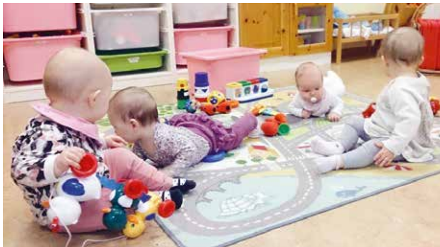
Stora och små är välkomna till babycaféet i S:ta Annagården på torsdagar 10.00-12.00.