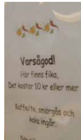
Att fika på Planeten kostar tio kronor - eller mer om man har råd!