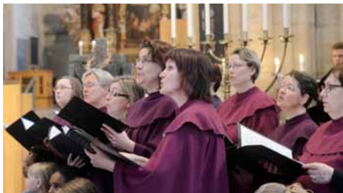
Sjunga i kör - något för dig?

Sopplunch serveras helgfria fredagar i Mariasalen 12.00-13.00, Kyrkans Hus. Höststart 19 september. Börja gärna med lite musik i domkyrkan 12.00 – en bra lunchpaus!