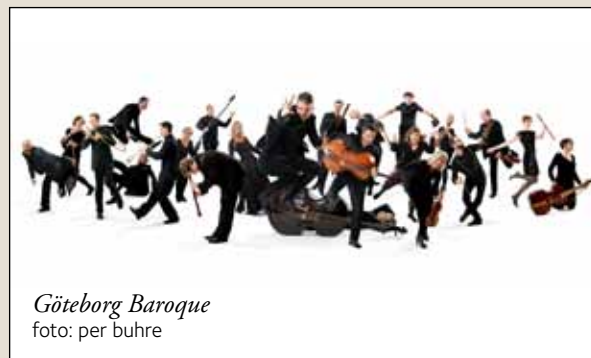
Göteborg Baroque