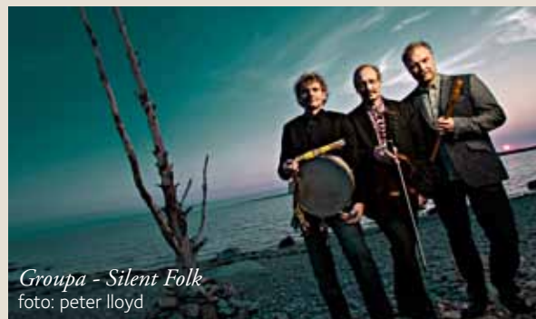
Groupa - Silent Folk

SÖNDAG 7 SEPTEMBER 19.30 Varnhems klosterkyrka Sommarmusik, Svenska Kammarkören.