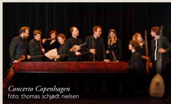
Concerto Copenhagen