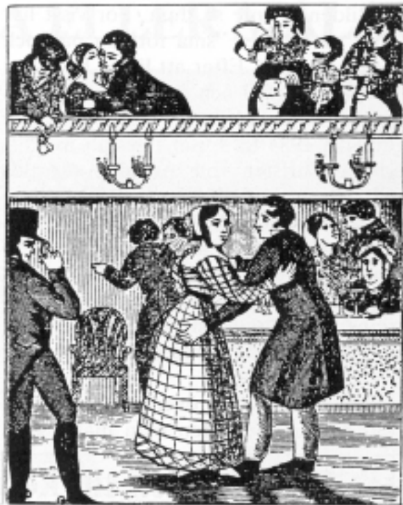
Uggleviksbalen. Träsnitt ur "Anna Cajsa Frodigs resa"