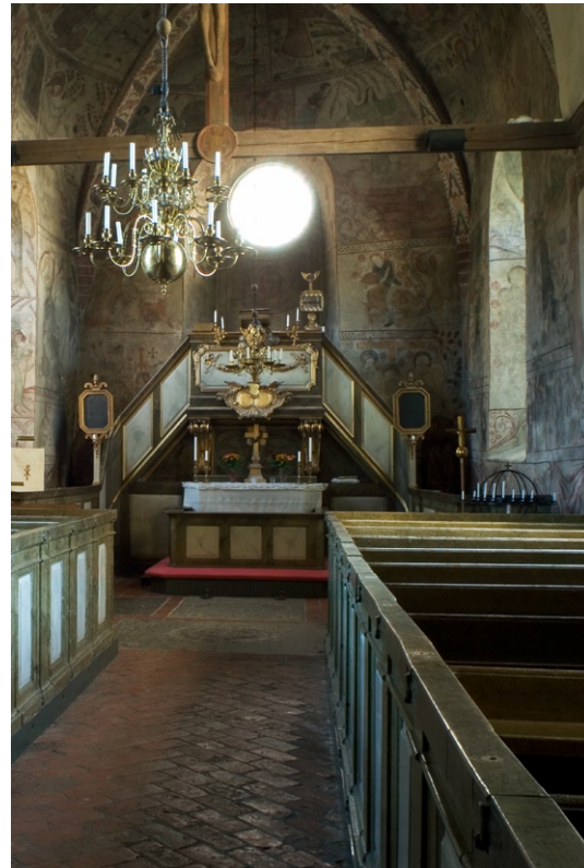
Kyrkorummet mot koret i öster.