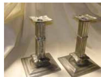
två av tenn med skaft i form av knippespelare från 1600-talet

två höga av mässing skänkta av fröken G. De Frese på Stommen