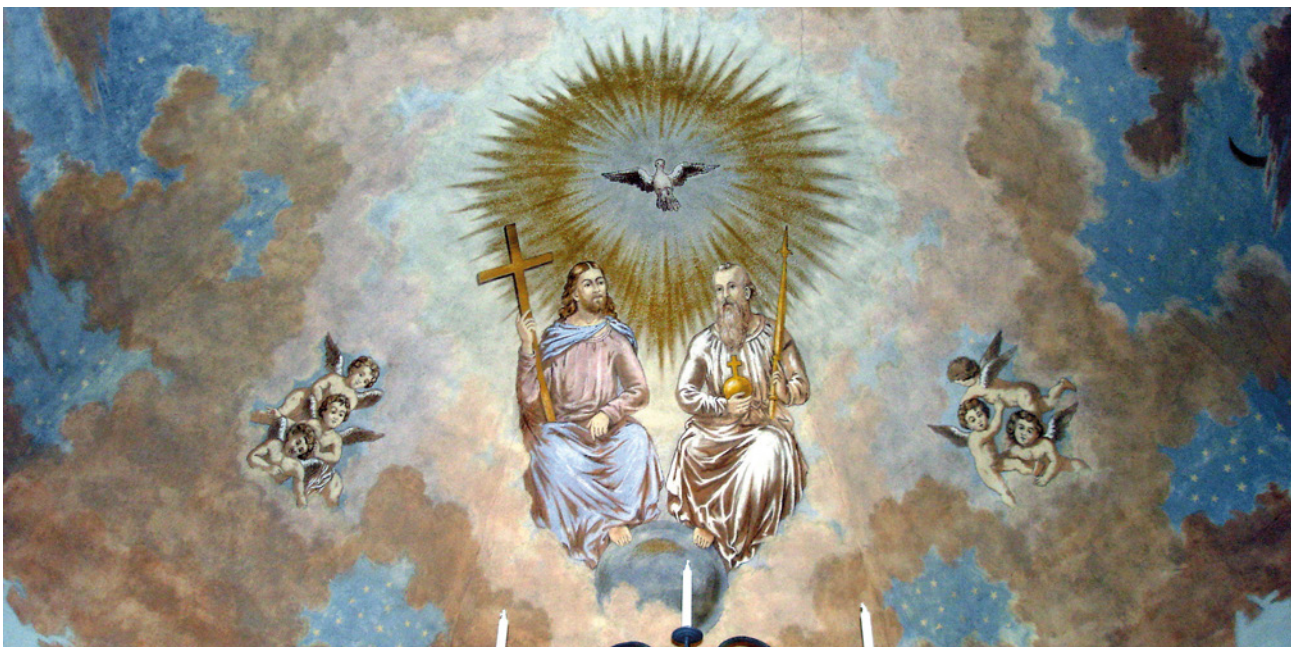
Takmålning i Näs kyrka.

Gud i sig uppfattas då av den icketroende som en sorts projektion för eller en längtan efter en fadersge-