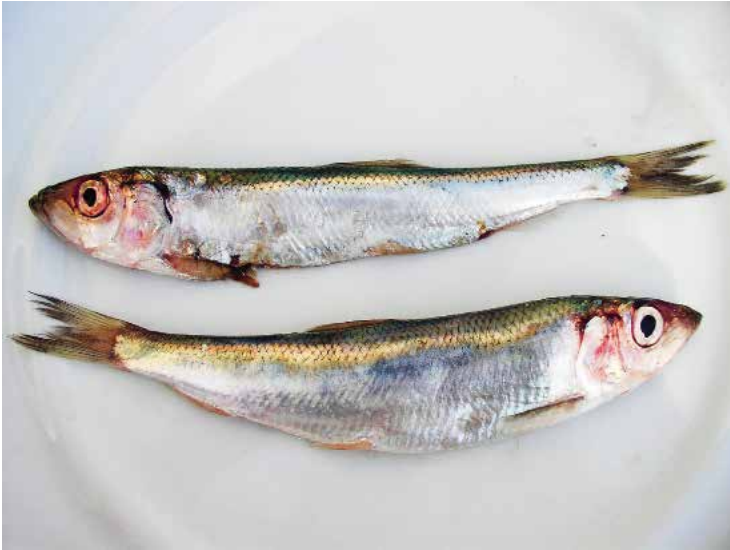
Fisken användes som symbol redan av de första kristna.

BOO FÖRSAMLING ÄR EN FÖRSAMLING där det händer mycket. Vi har ett arbete som spänner över hela livet, från småbarnssång och bibeläventyr till daglediga och pensionärskör. Men en sak är vi inte särskilt bra på. Att lyckas förmedla hur enastående viktig söndagens högmässa är. Vi firar förvisso många välfyllda gudstjänster under året, framför allt när musiken och barnen står i fokus, eller när julen nalkas. Men en vanlig högmässa mitt i terminen är det oftast bara hyggligt med folk. Gott så, men det finns plats för många fler!