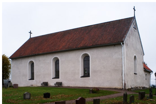
Exteriör från sydöst.

Kyrkans har spritputsade, vitkalkade fasader med slätputsade omfattningar och hörn. Den östra gaveln har en synlig sockel av gråsten, i