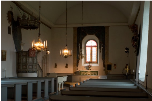
Kyrkorummet åt öst.

kristian har ett mindre stickbågigt fönster åt öster. Långhuset och sakristian har sadeltak täckta med tegel. Långhuset är försett med ett kors i vardera gavelkrönet.