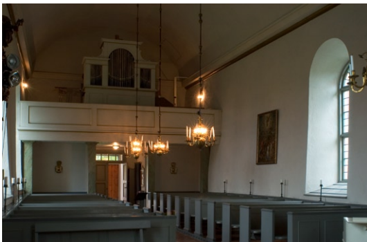
Kyrkorummet åt väst.

Kyrkorummet har en salkyrkoform med vitkalkade väggar täckt av ett putsat, vitkalkat tunnvalv. Runt kyrkorummet löper en vitmålad och förgylld taklist av trä. Tunnvalvet och listen samt draperimålningar kring korfönstret och bakom predikstolen kom till vid 1820 års ombyggnad. Från samma ombyggnad härrör läktaren med en rak, vitmålad läktarbarriär med för-