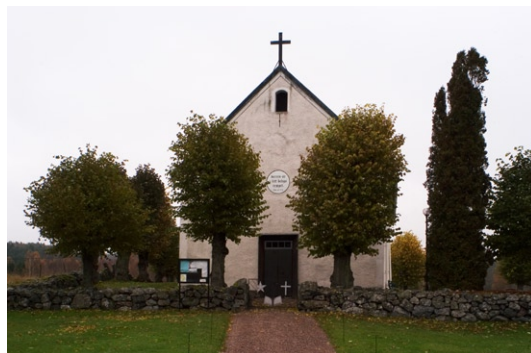
Exteriör från väst.

Fönsterna är rundbågiga försedda med gråmålade bågar och blyspröjsade glas. I långhusets västra gavelröste finns ett mindre stickbågigt fönster och i östra gaveln ett trekantsfönster. Sa-