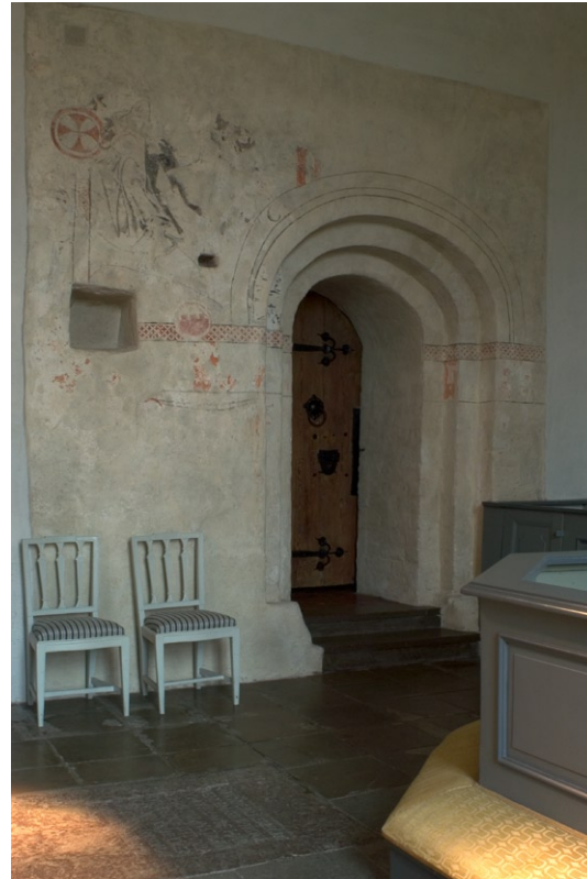
Ingång till sakristian omgiven av medeltida kalkmålningens fragment.

gyllda lister stående på kvadratiska marmorerade pelare.