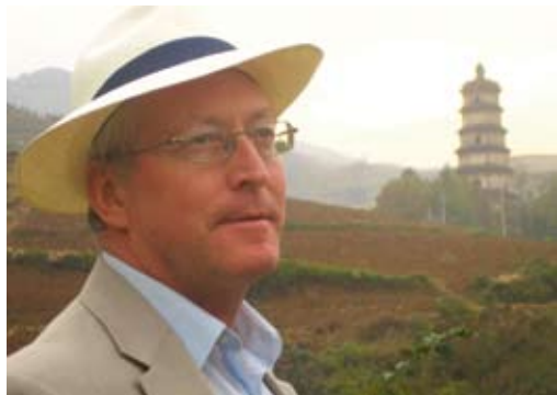
Prof. Diarmaid MacCulloch är professor i kyrkohistoria i Oxford men också diakonvigd i Anglikanska kyrkan. Hans bok "A history of Christianity – The First Three Thousand Years" som publicerades 2009, har kallats "en milstolpe inom sitt område" av Rowan Williams – ärkebiskop av Canterbury.

Anmälan till församlingsexpeditionen senast 21 september, tel. 20 68 00. Begränsat antal deltagare - först till kvarn.