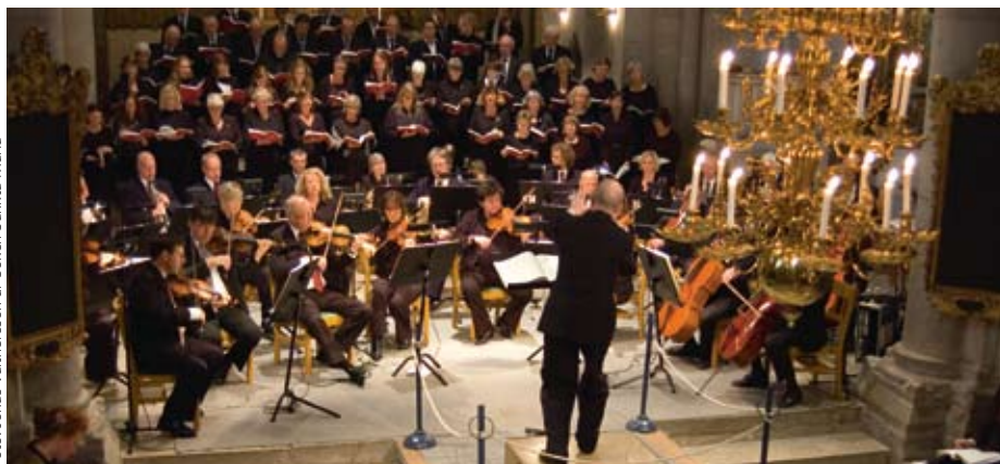
ur boken Sankta Maria