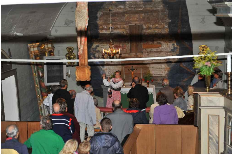
Visning i kyrkan under den stora hembygdsgdagen "Tångeråsa-dagen" 2009.