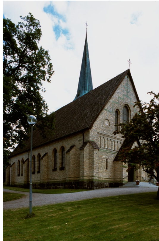
Exteriör från nordväst.

Kyrkan är uppförd av murtegel med gult fasadtegel, s k chamottetegel , framställt vid porslinsfabriken. Teglet är lagt i s k kryssförband med mönstermurningar som profilerad takgesims , sågsrift och blinderingar . Fasaderna är försedda med strävpelare och är rikt dekorerade med grönglaserade tegelskift och mönster. Södra och norra fasaderna har grönglaserade tegelkors med inmurade flaskbottnar. Enligt traditionen har porslinsfabrikens engelske verkmästare Barlow bidragit med dekorationen. Fönstren är spetsbågiga med mönstermurade omfattningar och har järnkarmar och småspröjsade, blyinfattade glas.