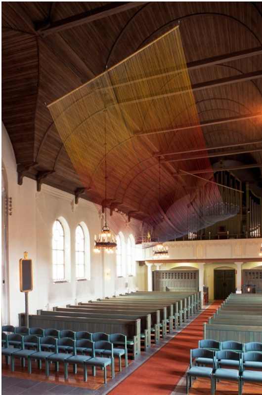
Kyrkorummet åt väst.

plattor, i podiet kompletterat under 1970-talet. Bänkkvarteren har lackade trägolv.