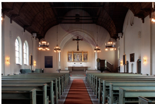
Kyrkorummet åt öst.

Den ursprungliga interiören har förenklats vid två större renoveringar under 1900-talet. Framförallt 1942 års renovering under ledning av arkitekt Erik Fant medförde en förenkling av kyrkorummets utsmyckning i funktionalismens anda då det mesta av jugenddekoren togs bort. Kyrkorummets jugendinspirerade kalkmålningar och grönglaserade tegelbröstning kalkades över. Vidare murades korets runda fönster igen, liksom västgavelns trefönstergrupp samt herrskapsläktaren i södra långhusväggen .