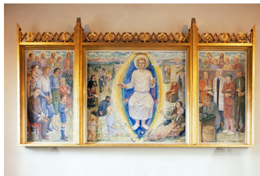
Altartavlan. © EINAR FORSETH/BUS 2008

Koret försågs vid 1940-talets renovering med en ny altartavla utförd av konstnären Einar Forseth (1892–1988). Altarringen nyttillverkades med geometriska mönster som återkommer i läktarbarriären från samma tid. Det murade altaret härrör från 1970-talets restaurering.