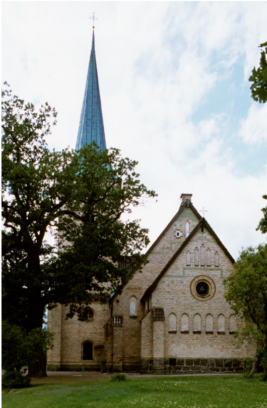
Exteriör från öst.