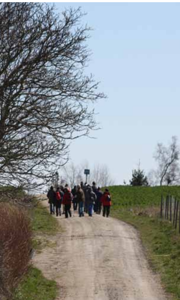
Gotländska S:t Olofsleden.