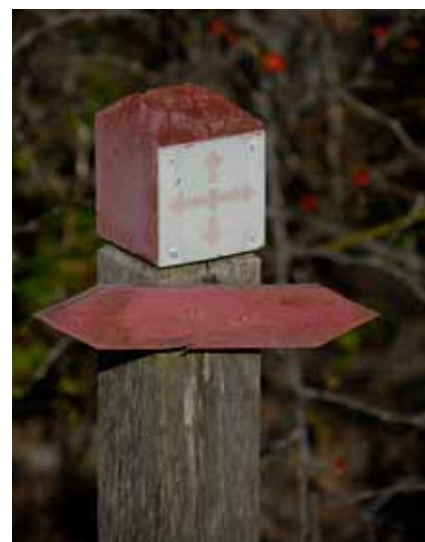
Leden är märkt med St Olofskorset

Vandringen var ett samarrangemang mellan Lärbro hembygdsförening, Sensus och Svenska kyrkan i Lärbro pastorat