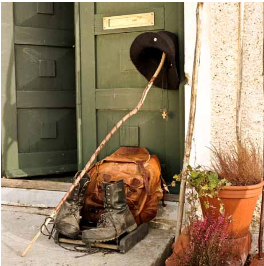
En öppen dörr vid vägens slut.