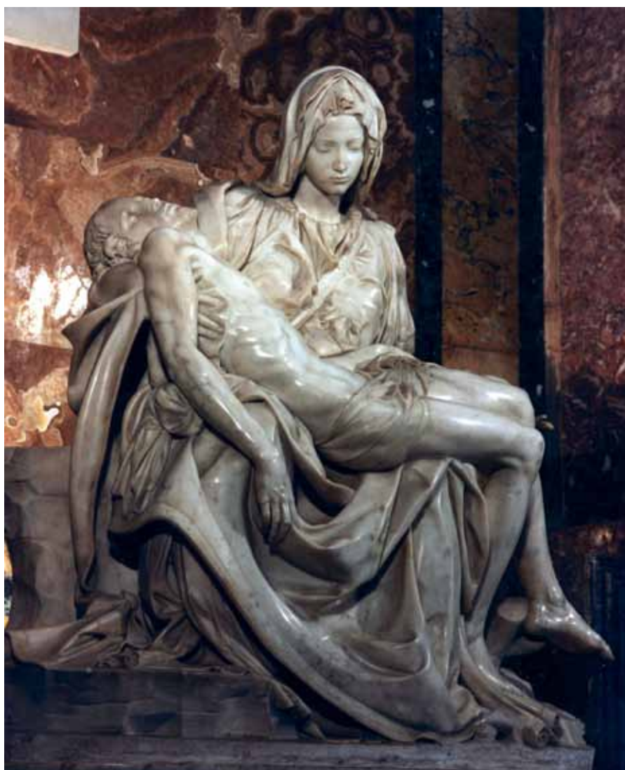
Michelangelos "Pietà" i Peterskyrkan, Rom