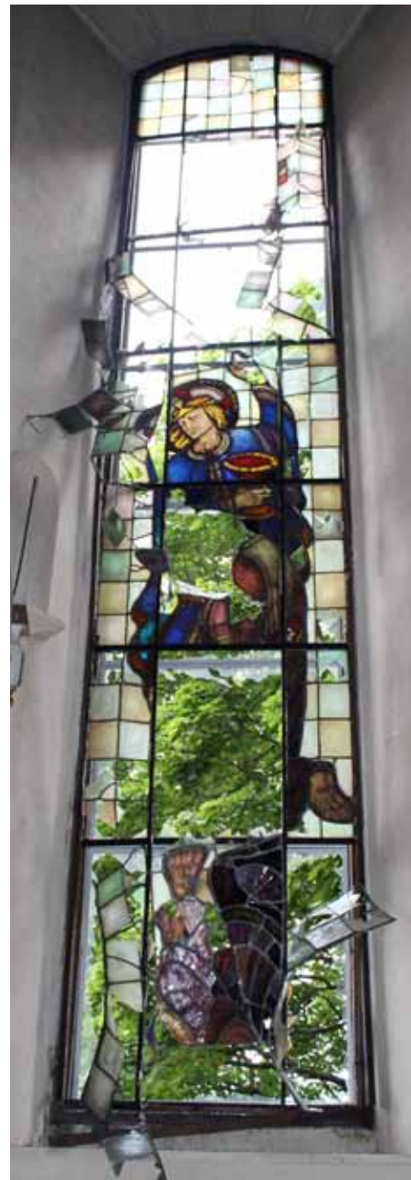
Bomben i Oslo den 22 juli krossade Margareta kyrkans fönster.