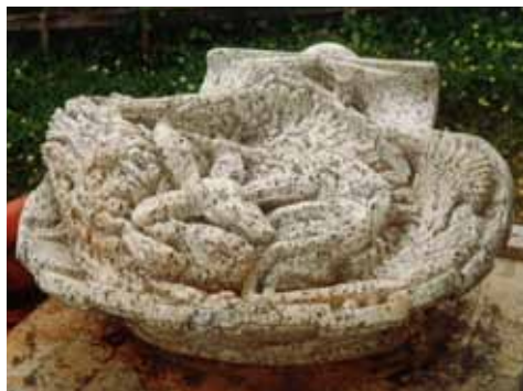
Snäckan, står i botaniska trädgården i Västerås.

Även om hans konstverk framförallt gick till privatpersoner i omgivningen