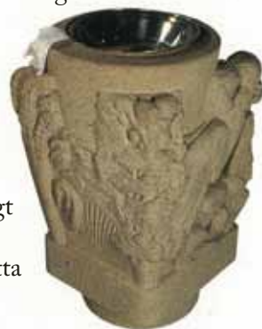
Dopfunten i Vittinge kyrka.