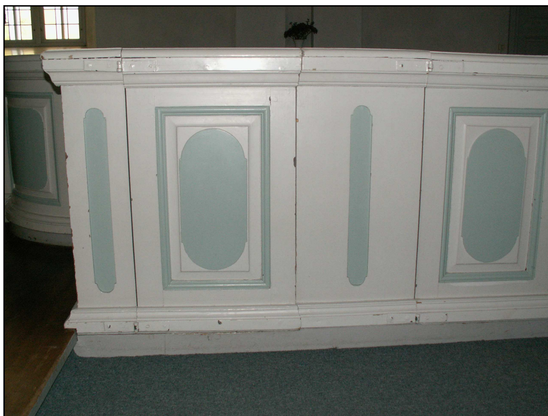
Bänkinredningen från 1790, Södra kvarterets främre del. Bänkgavlarna breddades 1928. Ursprungliga gavelbredden ses på bänkskärmen mot koret (till vänster på bilden). Lägg märke till spegelfyllningarnas rundade hörn.

Kyrkan restaurerades efter ett förslag av arkitekten Carl Bååth i Bollnäs. Förändringarna i kyrkorummet var främst borttagande av värmeapparat, omändring av bänkarna (breddning av gavlarna, minskande av antal och lutning av bänkryggarna), ommålning och omläggning av golv med bevarande av äldre golvplank i koret. Uppmättningsritningen visar att koret ursprungligen låg två trappsteg högre än långhuset. Förslaget som Bååth upprättade visar att koret och långhuset skulle ligga i samma nivå. I samband med renoveringen sänktes koret ett trappsteg.