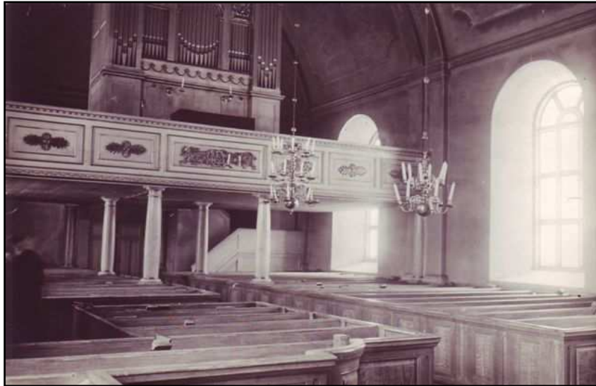
Foto från före 1928, lägg märke till läktarens storlek