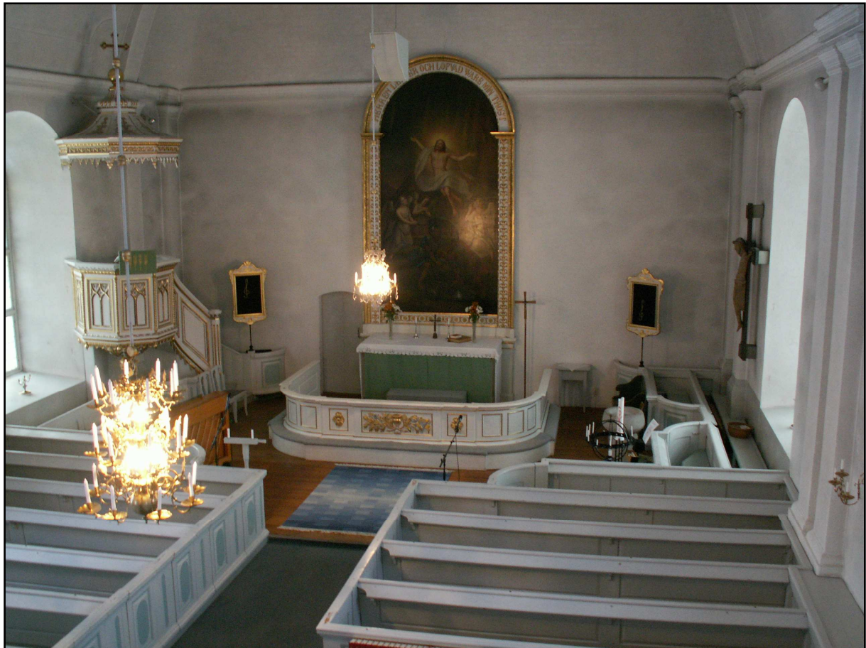
Nuvarande interiör, Undersviks kyrka.

Åren närmaste efter kyrkans färdigställande inreddes kyrkorummet med bänkar, korbänksinredning, altarring och altare. På altaret placerades en äldre predikstol från 1600-talet. En större trätavla med uppgifter om kyrkans uppförande placerades på okänt ställe i kyrkorummet. 3 Mästaren Olof Backström, Arbrå (som hade arbetat åt Magnus Granlund) och snickaren Källström stod för inredningen. 4 En brudbänk snickrades 1794 av Erik Källström. 5 Både tavlan och brudbänken är avfärgade i grönt, vilket även är den färg som syns på bänkinredningen korbänksinredning och altarringen som underst liggande färglager. 6 Sannolikt var hela inredningen ursprungligen målad i grönt.