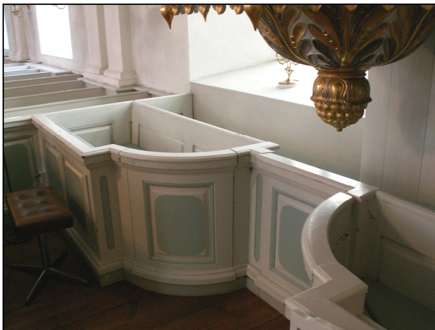
Korbänkarna i korets norra del

Korbänksinredningen består av två bänkrader på var sida, där den främre har delats av för att göra det möjligt att komma in till den bakre. På var sida om denna gång har bänkdörrarna till den klivna första bänken getts svängd form (se uppmättningsritning). I samband med predikstolens uppsättning 1865 ändrades den norra korbänksinredningen något. Predikstolen placerades rakt över den främre östra bänken och delar av den bakre bänken.