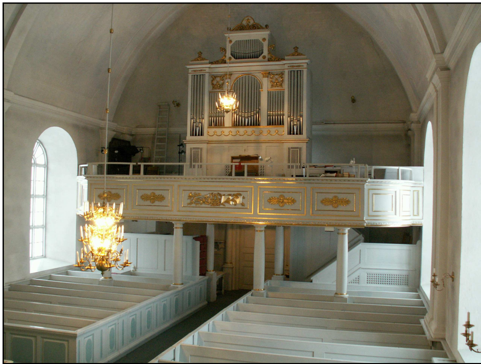
Läktarens utseende efter ombyggnaden 1956

Nya fönster och karmar, nya innerdörrar efter bevarade 1700-talsoriginal tillkom. Spegelarna på dörrarna fick nu en avvikande grönblå nyans. Ny orgel byggdes bakom den gamla fasaden, enda förändringen i fasaden var nytt spelbort och nya andrag. Väggarnas pilastrar och valvets gördelbågar fick avvikande grå kulör, väggarna målades gråvita. 10