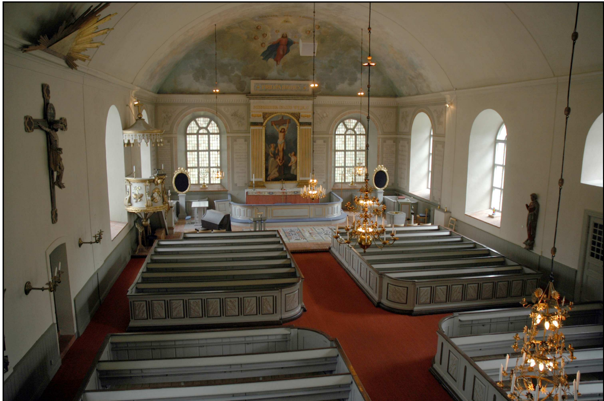
Norrbo kyrka Hälsingland med liknande bänkinredning som i Undersviks kyrka

Segersta kyrka uppfördes 1808-11. Kyrkan har nyklassicistisk inredning och upplevs som mycket ljus. Korväggen är genombruten av två fönster. Altarring och bänkinredning har vissa likheter med motsvarigheterna i Undersvik. Bänkdörrarnas speglar har samma rundade fyllningar som i Undersvik och i Gnarp. 32