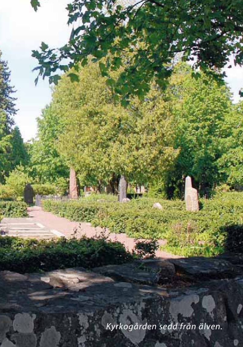
Kyrkogården sedd från älven.