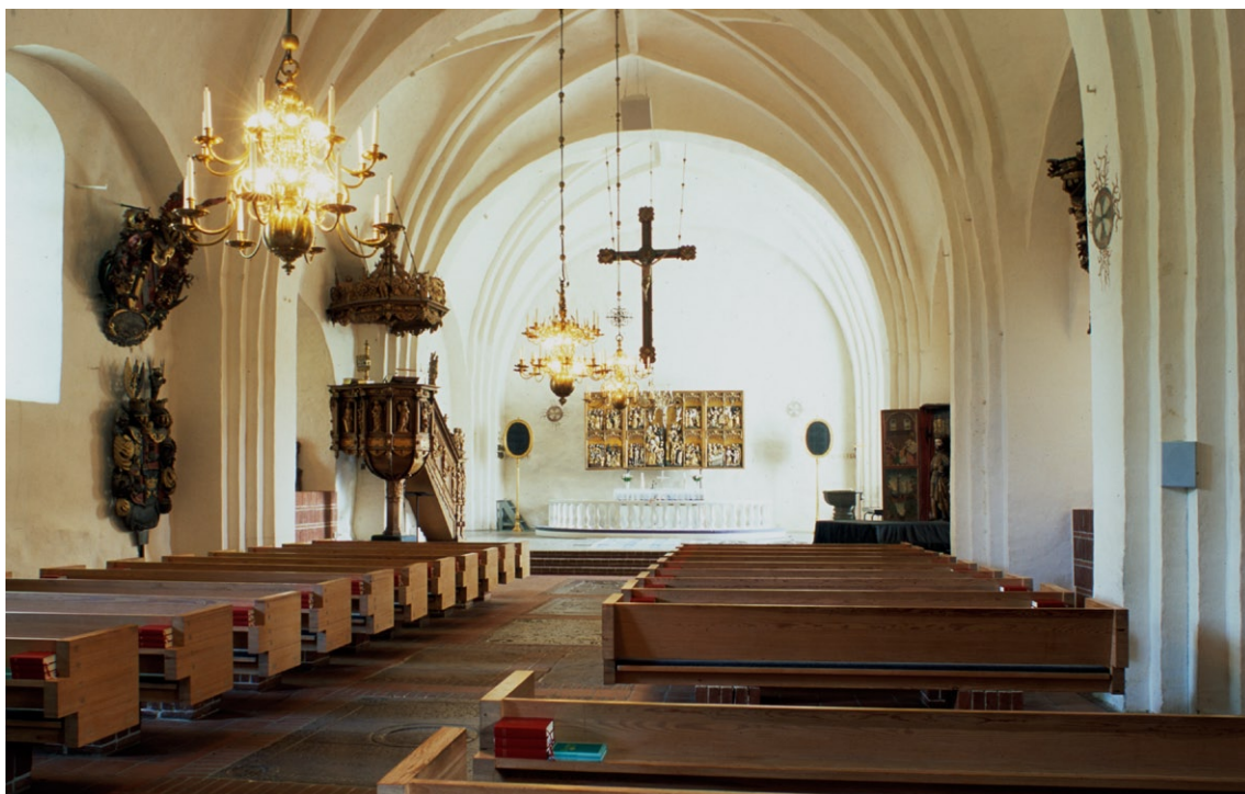
Kyrkorummet mot öst.

Vapenhuset är liksom sakristian uppfört under 1430-talet och har vitkalkade väggar och ett ursprungligt kryssvalv . Kyrkans ursprungliga sydportal, ingången till långhuset, är bevarad