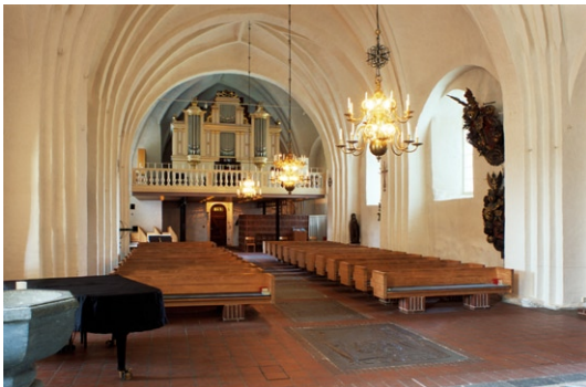
Kyrkorummet mot väst.

Bänkinredningen av furu på tegelpostament tillkom på 1960-talet. Även orgelläktaren härrör från samma tid och är utförd fristående på pelare av brunmålat stål. Läktarbarriären består av vitmålad svarvade pelare. Under läktaren uppfördes samtidigt ett omklädningsbås av tegel samt