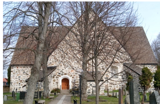
Exteriör från söder.

Ingångar till kyrkan finns i vapenhuset samt i västra gaveln, båda försedda med portar som nyttillverkats under 1990-talet. Granittrappan till sydportalen är även den nyttillverkad.