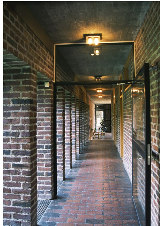
Korridor mellan vapenhus och församlingslokaler.

Från vapenhuset leder en korridor till byggnadens församlingsutrymmen. Korridorens ena sida vetter mot den kringbyggda gården. Från tegelgolvet sträcker sig höga, smala fönster i djupa nischer, vars tegelmurar liknar pelare kring en klostergård. På motsstående sida leder omålade furudörrar in till olika rum. Utmed gårdens södra sida ligger det s k vardagsrummet, ett samlingsrum kring ett pentry med bardisk. Golv och väggar är av tegel medan taket täcks av