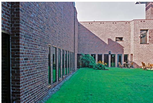
Den kringbyggda gården.

Framför huvudingången till kyrkan bildas en kyrkbacke genom att en lätt svängd granitmur avskärmar mot busstorget. På platsen står ett fem meter högt kors i polerat stål. Marken är belagd med gatsten, mönsterlagd i cirklar på samma sätt som i övriga Vällingby centrum. Arkitekten Erik Glemme står för formgivningen