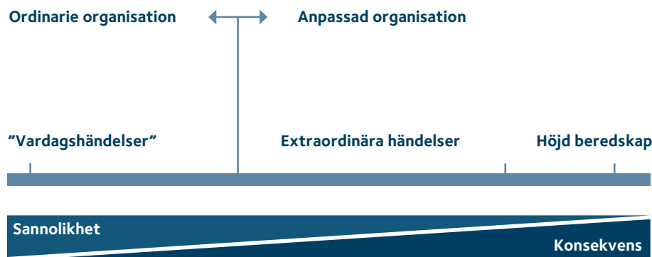
Figur 1. Krisberedskapsmyndighetens krisskala

Sannolika händelser som får mindre konsekvenser för organisationen och verksamheten bör kunna hanteras inom ordinarie rutiner och beredskap. För extraordinära händelser och höjd beredskap krävs särskilda insatser av en förberedd och ibland förstärkt organisation. Handbokens term ”allvarlig händelse” ligger på skalan mellan vardagshändelsen och den extraordinära händelsen.